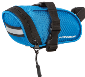
Kross Roamer Saddle Bag L - Niebieski