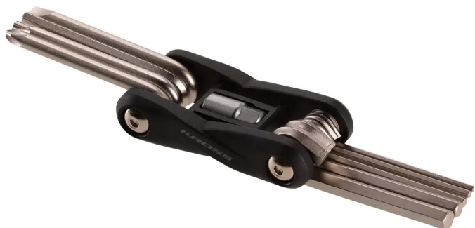
Kross Smart 10 funkcji