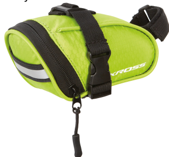
Kross Roamer Saddle Bag S - żółty