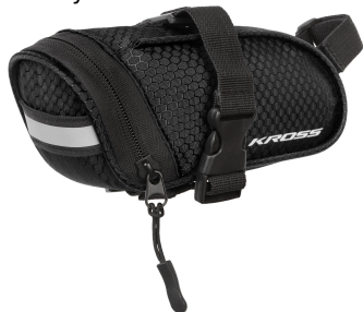
Kross Roamer Saddle Bag L - czarny