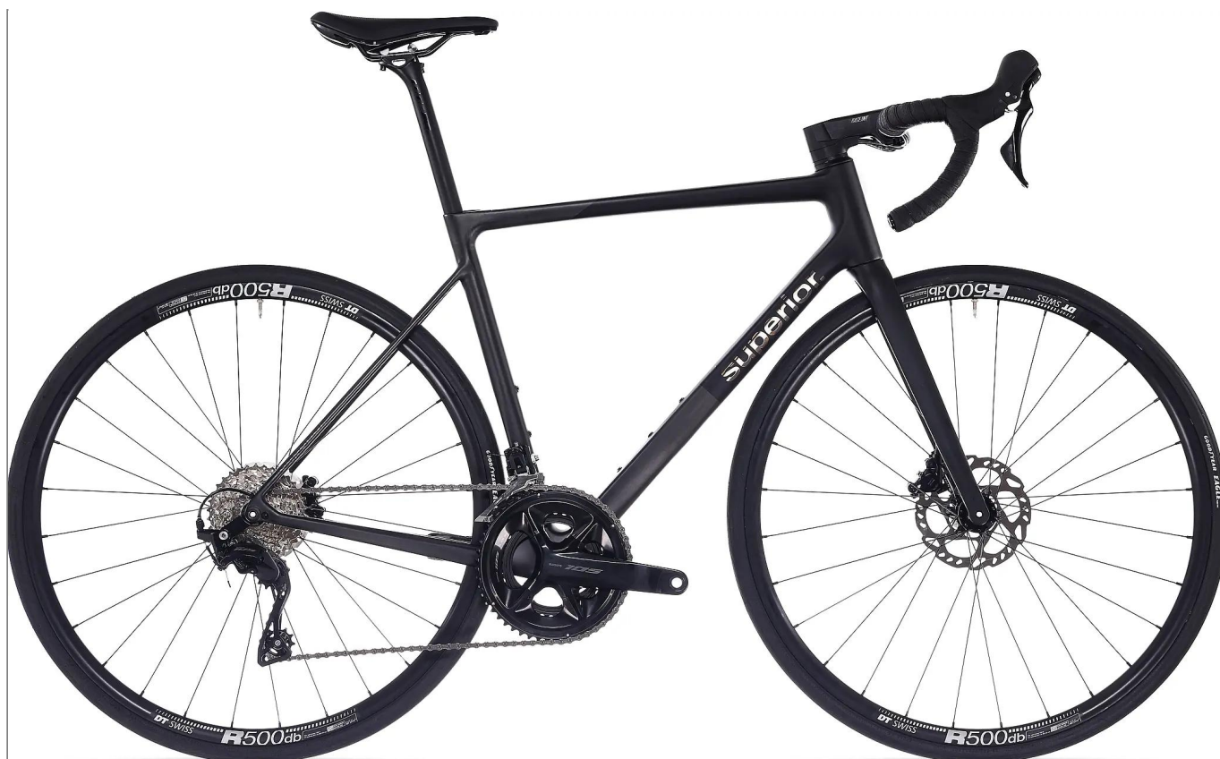
Superior RR 9.4 - Carbon Performance Road