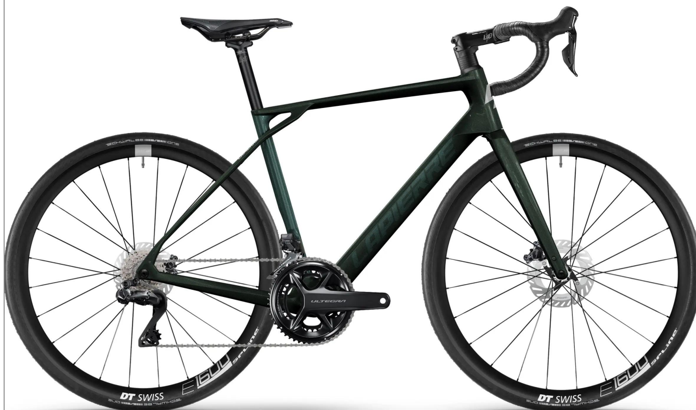
Lapierre Pulsium 7.0 - wyczynowa szosa endurance