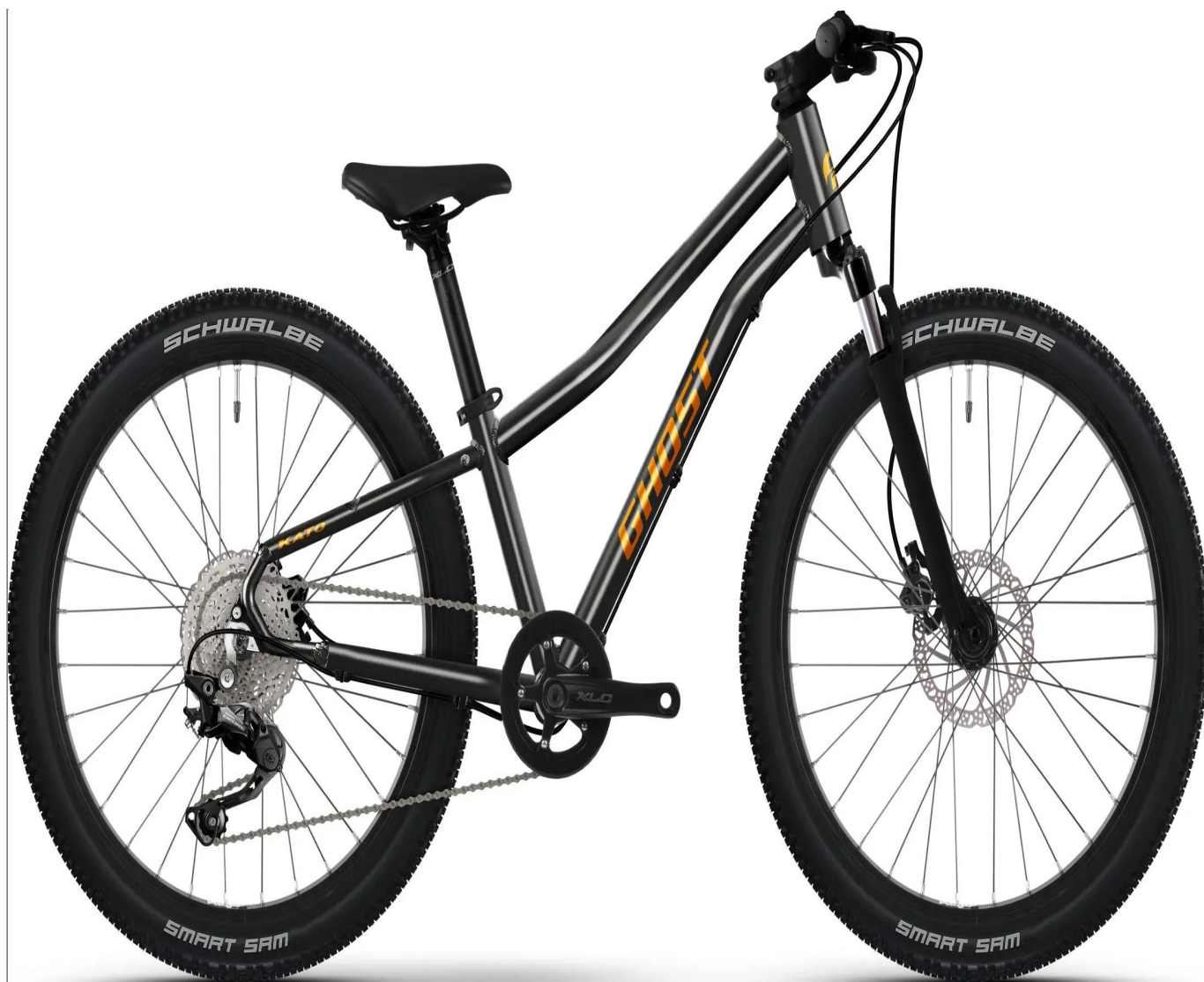
Ghost Kato 24 Pro - kolor czarny