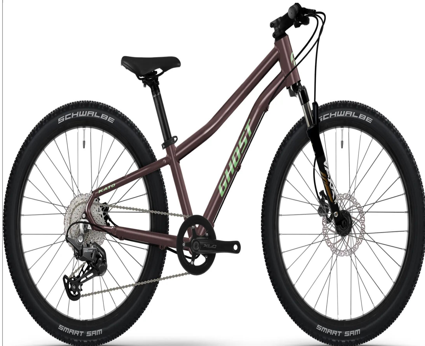
Ghost Kato 24 Full Party - kolor fioletowy

Topowy hardtail dla dzieci na kołach 24", wyposażony w amortyzator o skoku 80mm oraz precyzyjny napęd 11-rzędowy. Idealna maszyna dla młodych ambitnych rowerzystów szukających wysokiej wydajności w terenie.