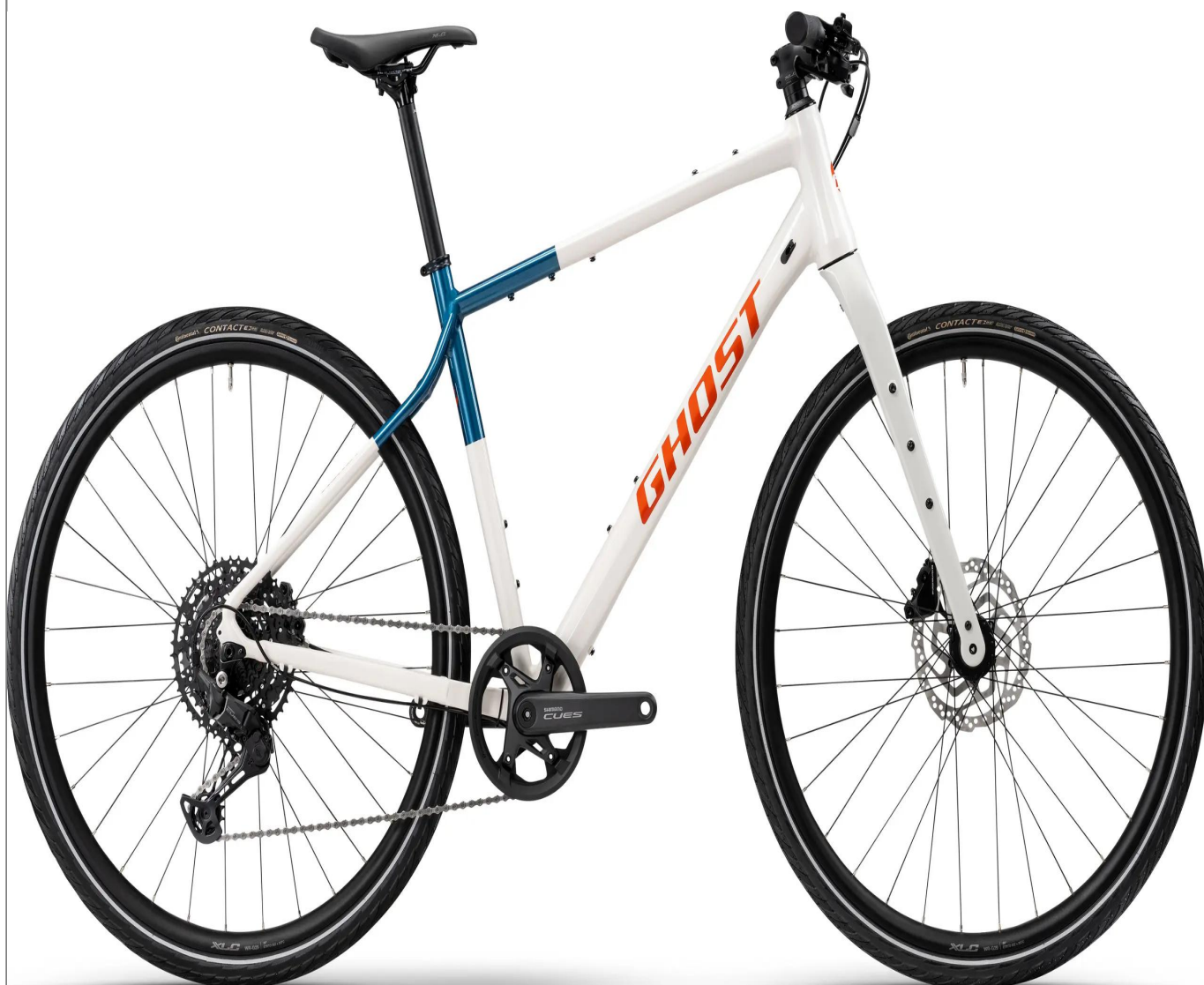
Ghost Urban Asket - kolor biały

Idealny rower typu Urban Fitness, który łączy duszę gravela z funkcjonalnością miejską. Ghost Urban Asket w kolorze białym oferuje prostą kierownicę (Flat Bar) dla pełnej kontroli nad ruchem ulicznym przy zachowaniu lekkości i szybkości roweru szutrowego.