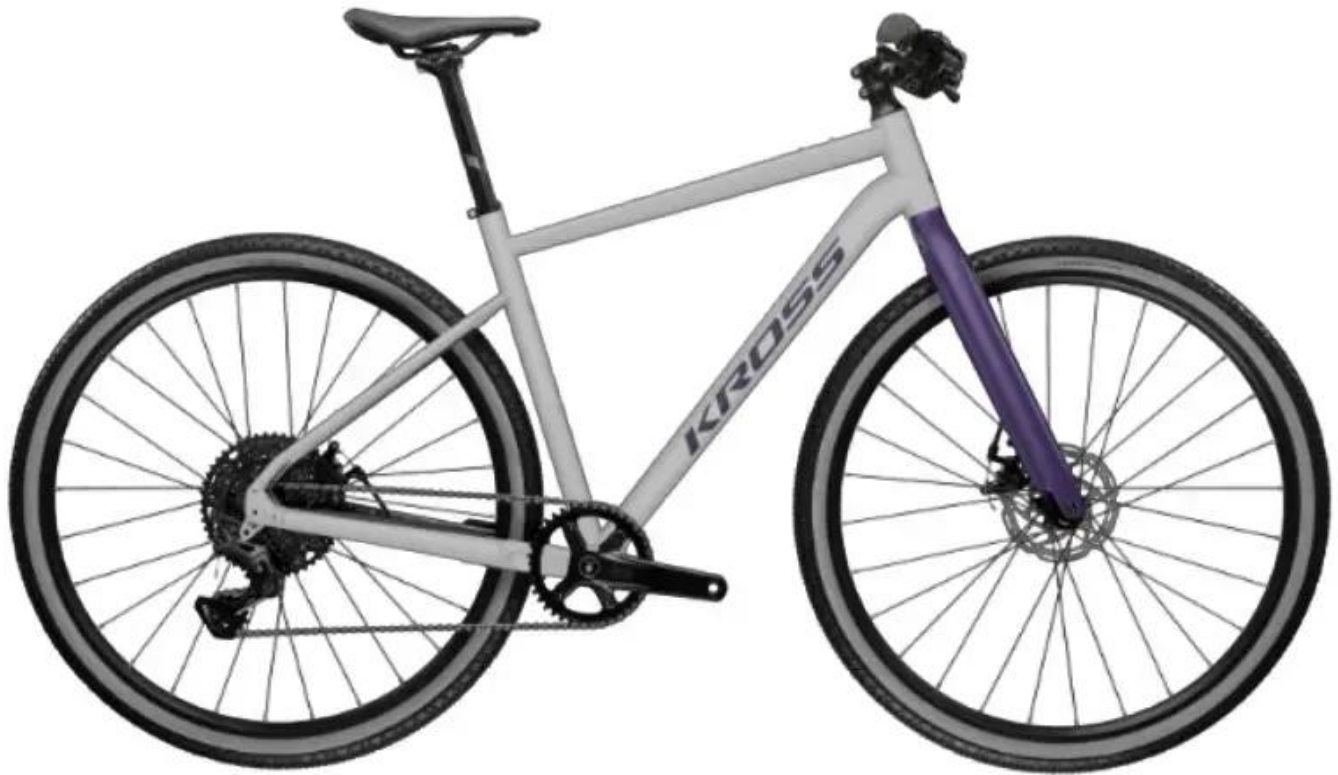
Grafika przedprodukcyjna, zdjęcia studyjne wkrótce

Rewolucją w tym modelu jest zastosowanie nowoczesnej grupy Shimano CUES 2x9 z technologią LinkGlide , która trzykrotnie zwiększa trwałość napędu i gwarantuje płynną zmianę przełożeń pod obciążeniem. Dzięki połączeniu szerokich opon Schwalbe G-One Comp 45C , hydraulicznych hamulców tarczowych oraz licznych punktów montażowych pod akcesoria, Esker 1.0 FL staje się idealnym narzędziem do bikepackingu, szybkiej turystyki oraz sprawnego poruszania się w miejskiej dżungli.