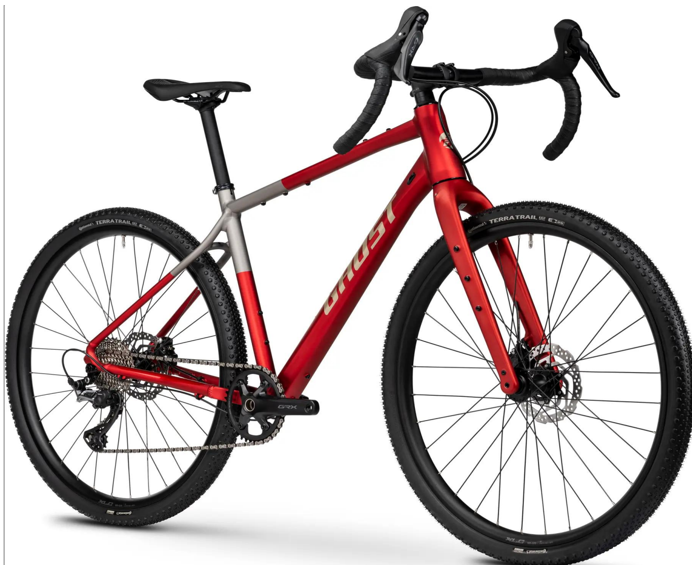
Ghost Asket 2026 - kolor czerwony