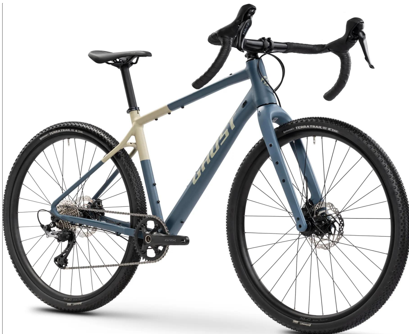
Ghost Asket 2026 - kolor niebieski