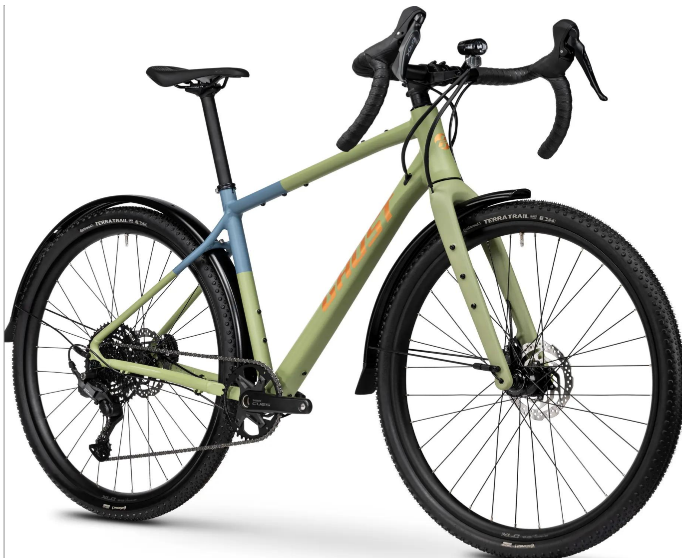
Ghost Asket EQ 2026 - kolor zielony