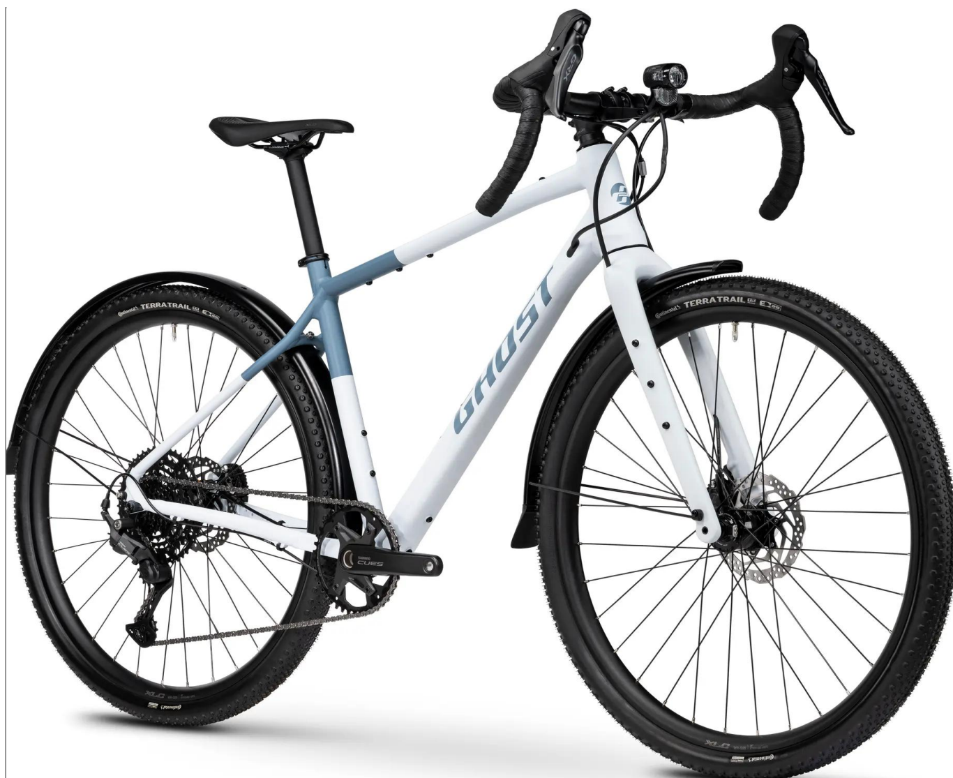
Ghost Asket EQ 2026 - kolor biały