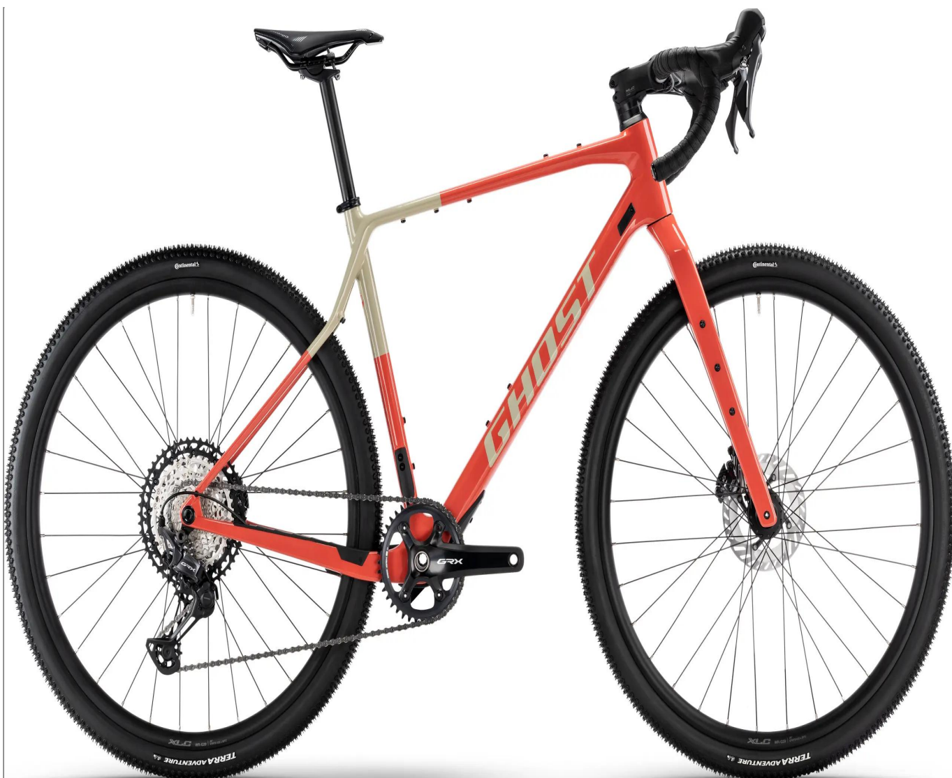
Ghost Asket CF Pro - kolor czerwony