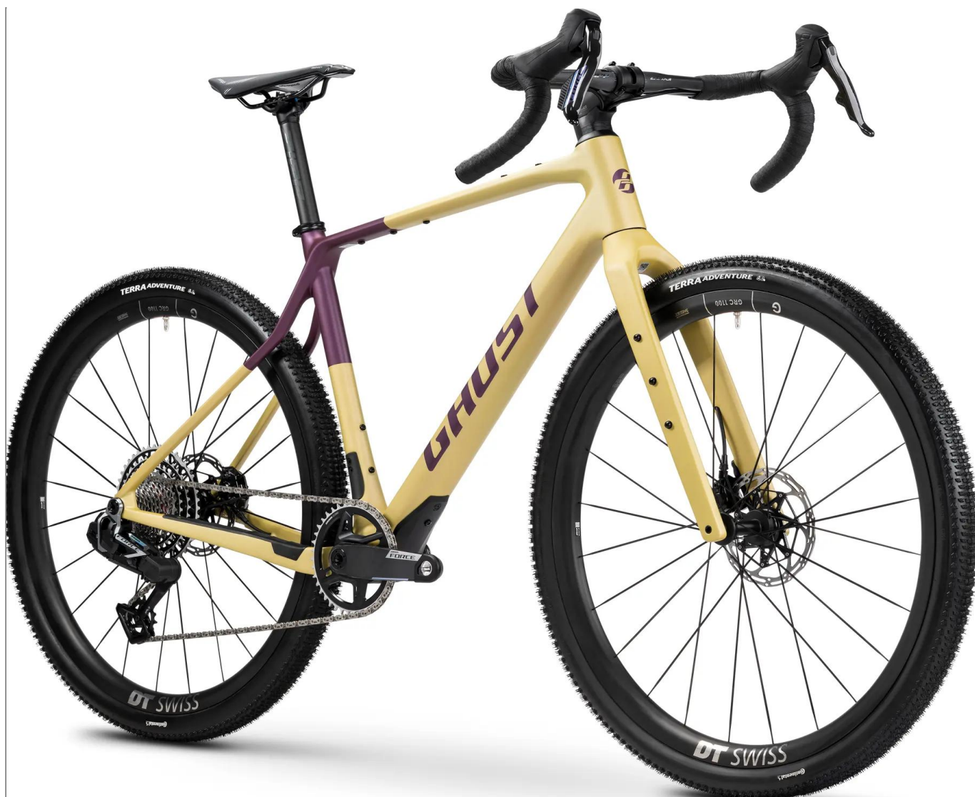
Ghost Asket CF LTD 2026 - kolor Honey