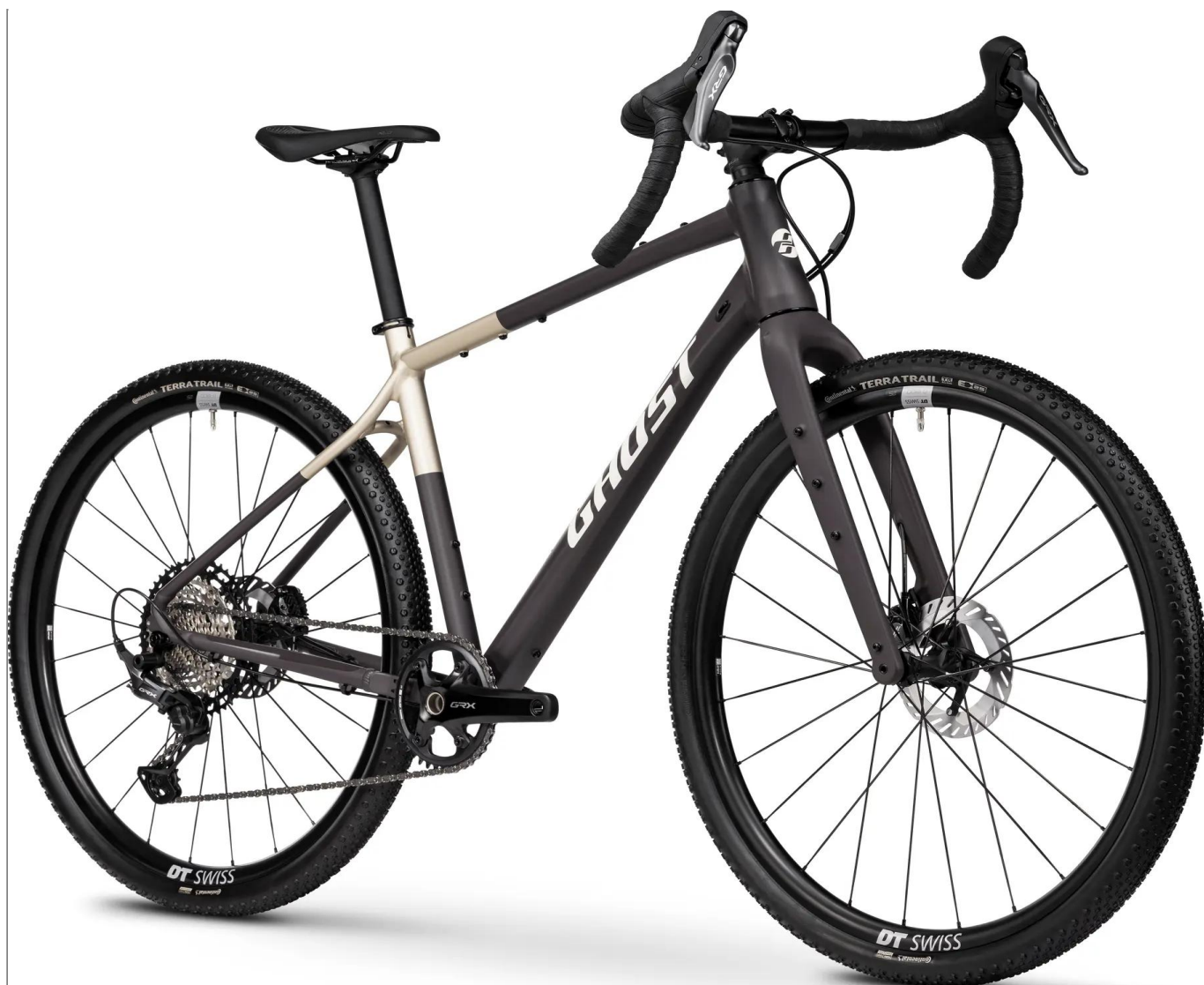
Ghost Asket Advanced 2026 - kolor Slate Shadow