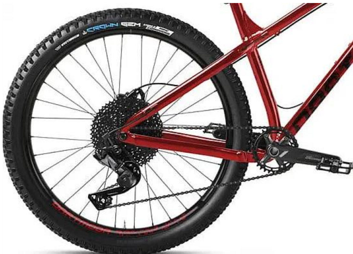
Niezawodny napęd Microshift AdventX