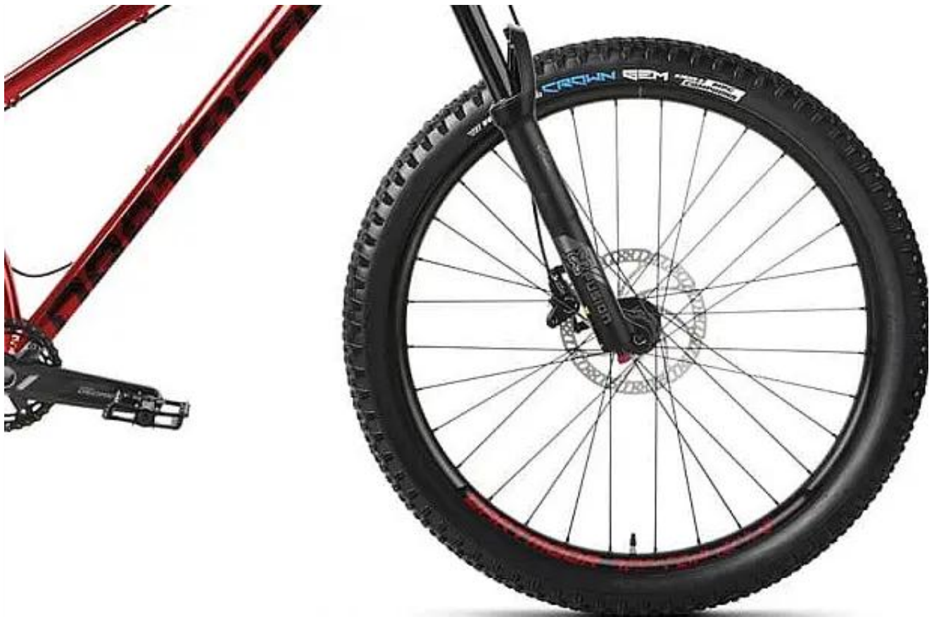
Amortyzator X-Fusion RC32 130mm