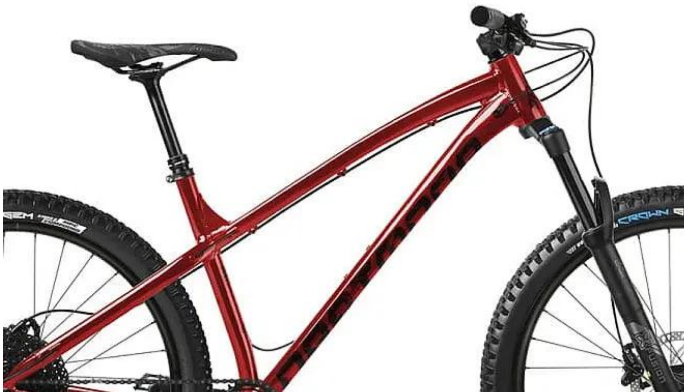
Rama aluminiowa w kolorze Red Devil