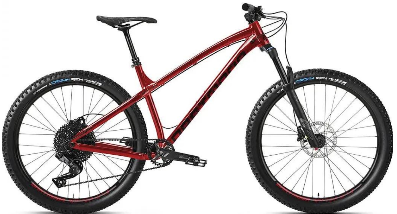
Nowoczesna geometria trailowa