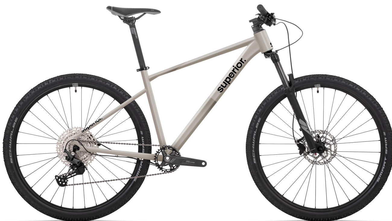
Superior XC 6.9 Dust – wizualizacja przedprodukcyjna

Model XC 6.9 stawia na najnowsze rozwiązania rynkowe, wprowadzając napęd Shimano CUES 1x11 . Jest to system zaprojektowany z myślą o maksymalnej bezobsługowości i płynności pracy, co w połączeniu z amortyzatorem powietrznym o skoku 120 mm tworzy zestaw idealny dla zaawansowanego hobbysty. System pełnej integracji przewodów ICR oraz technologia wygładzonych spawów sprawiają, że rower prezentuje się niezwykle schludnie, oferując jakość prowadzenia i estetykę spotykaną dotąd w znacznie droższych modelach.