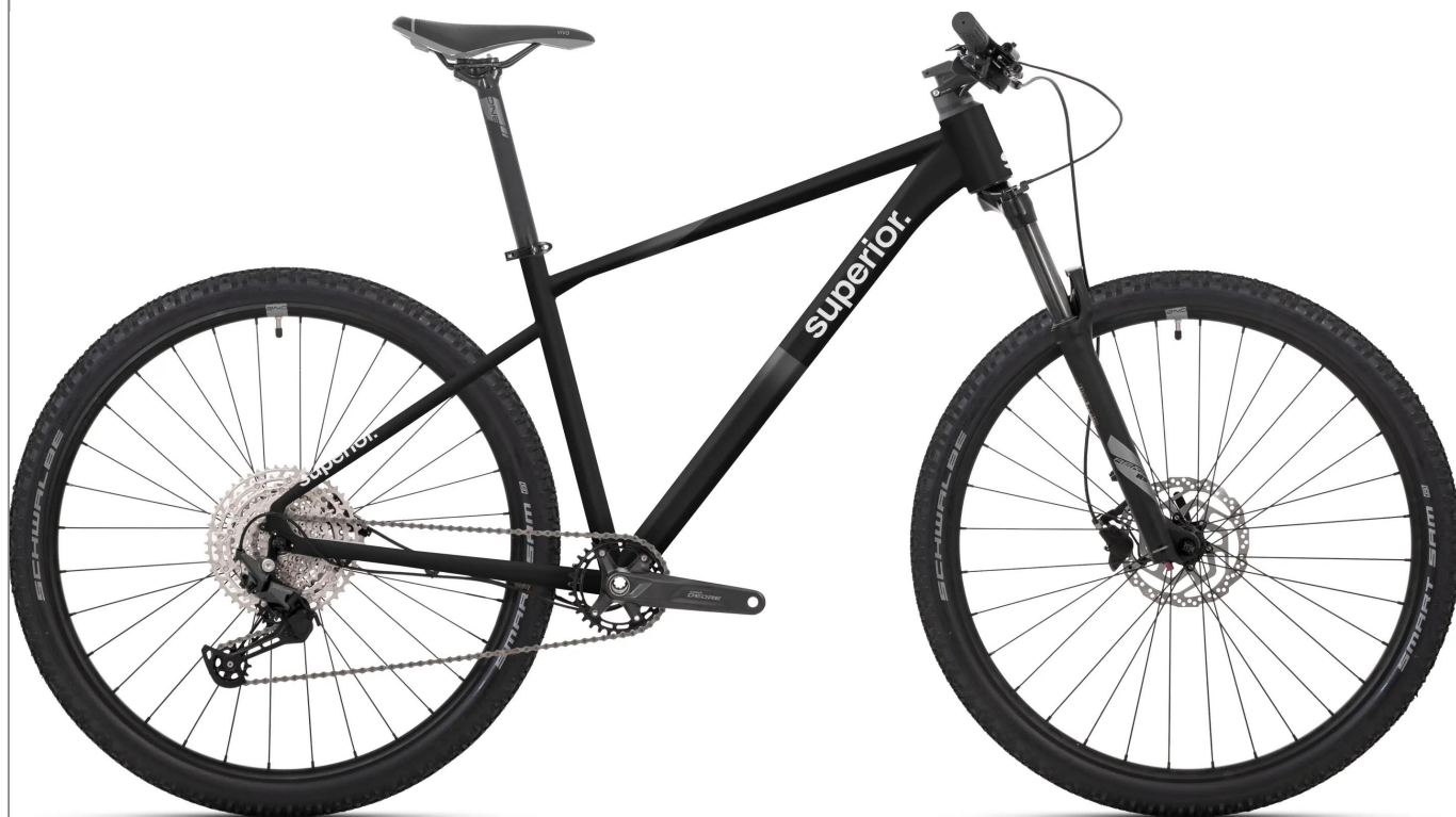
Superior XC 6.0 – wydajność i nowoczesny design

Nowoczesny rower MTB o sportowej charakterystyce. Model XC 6.0 na ramie z aluminium 6061 oferuje progresywną geometrię z kątem główki 67° oraz wyjątkowo krótkim tyłem (422 mm), co przekłada się na pewne prowadzenie i zwinność.