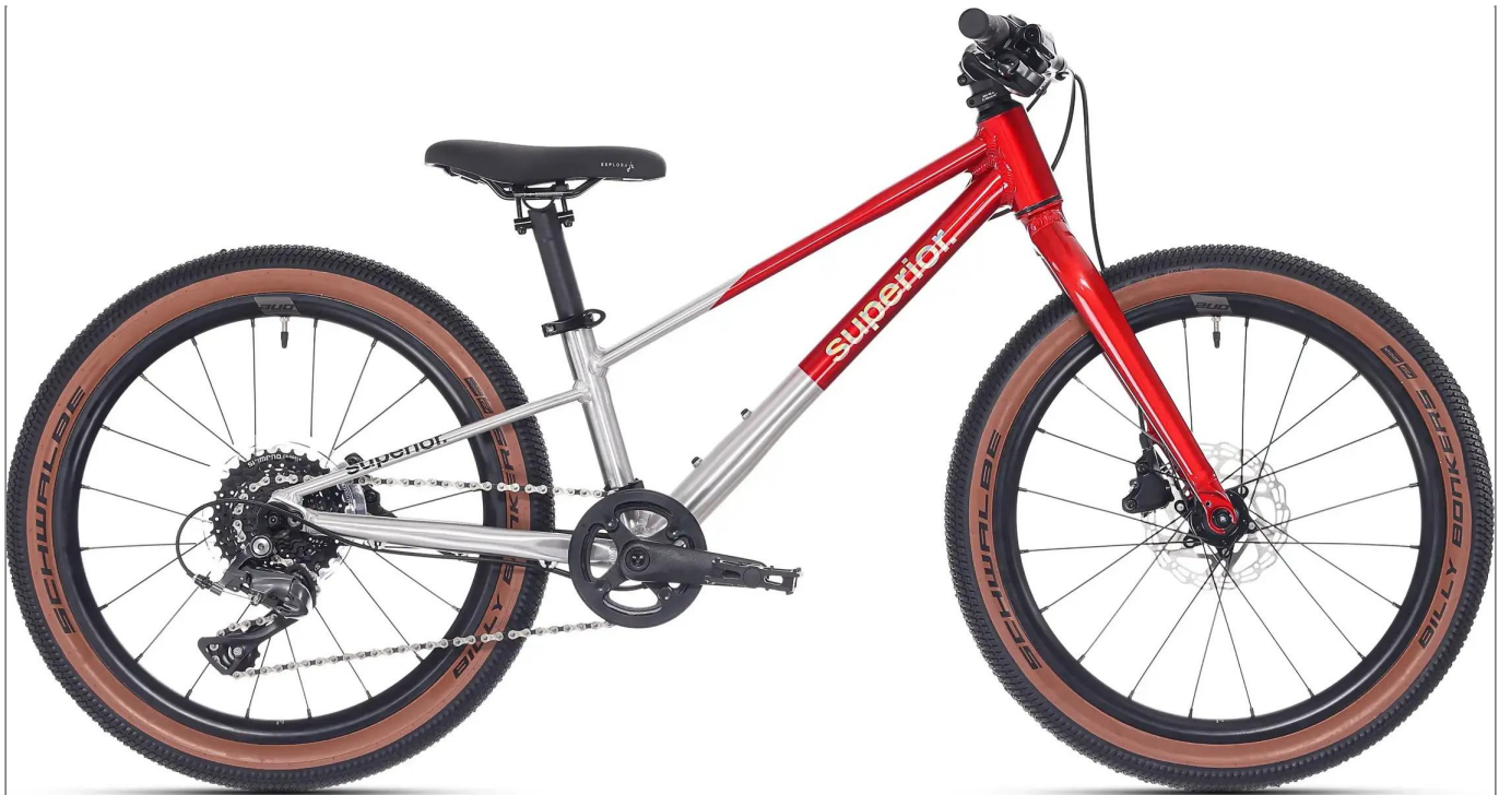
Superior TEAM 20 - profesjonalny hardtail 20"