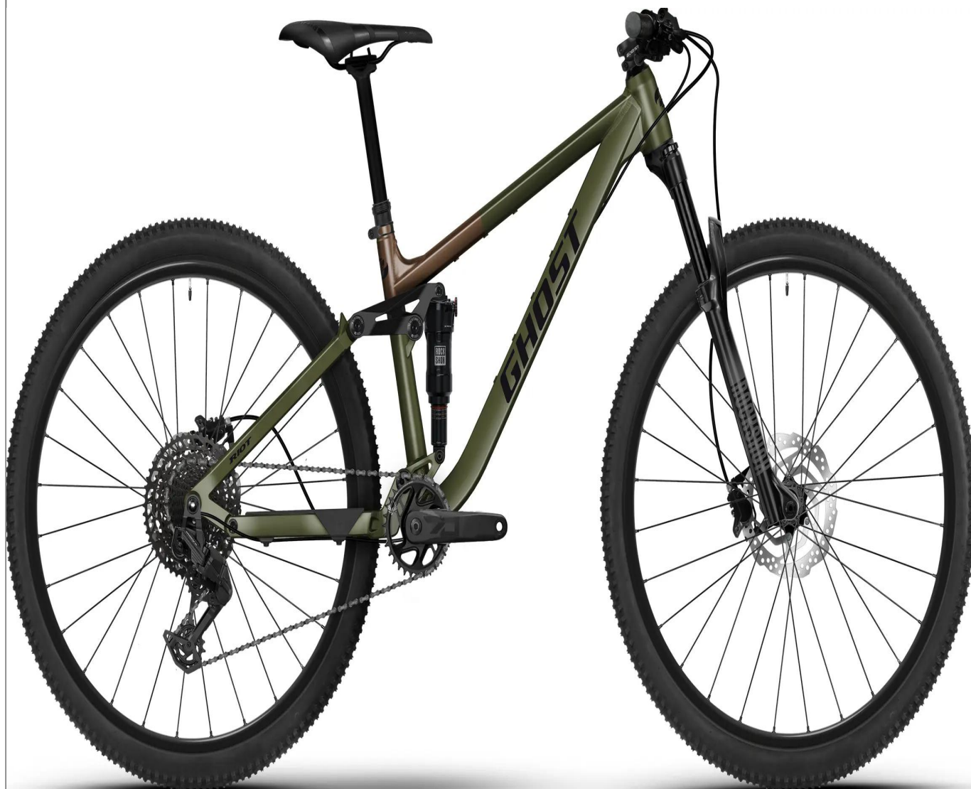
Ghost Riot Youth Pro – rower trailowy dla młodzieży

Pełnoprawny rower ścieżkowy dla młodzieży, skalowany do potrzeb lżejszych riderów. Posiada zawieszenie o skoku 130mm oraz koła 27.5", stanowiąc idealny pomost między rowerami dziecięcymi a modelami dla dorosłych.