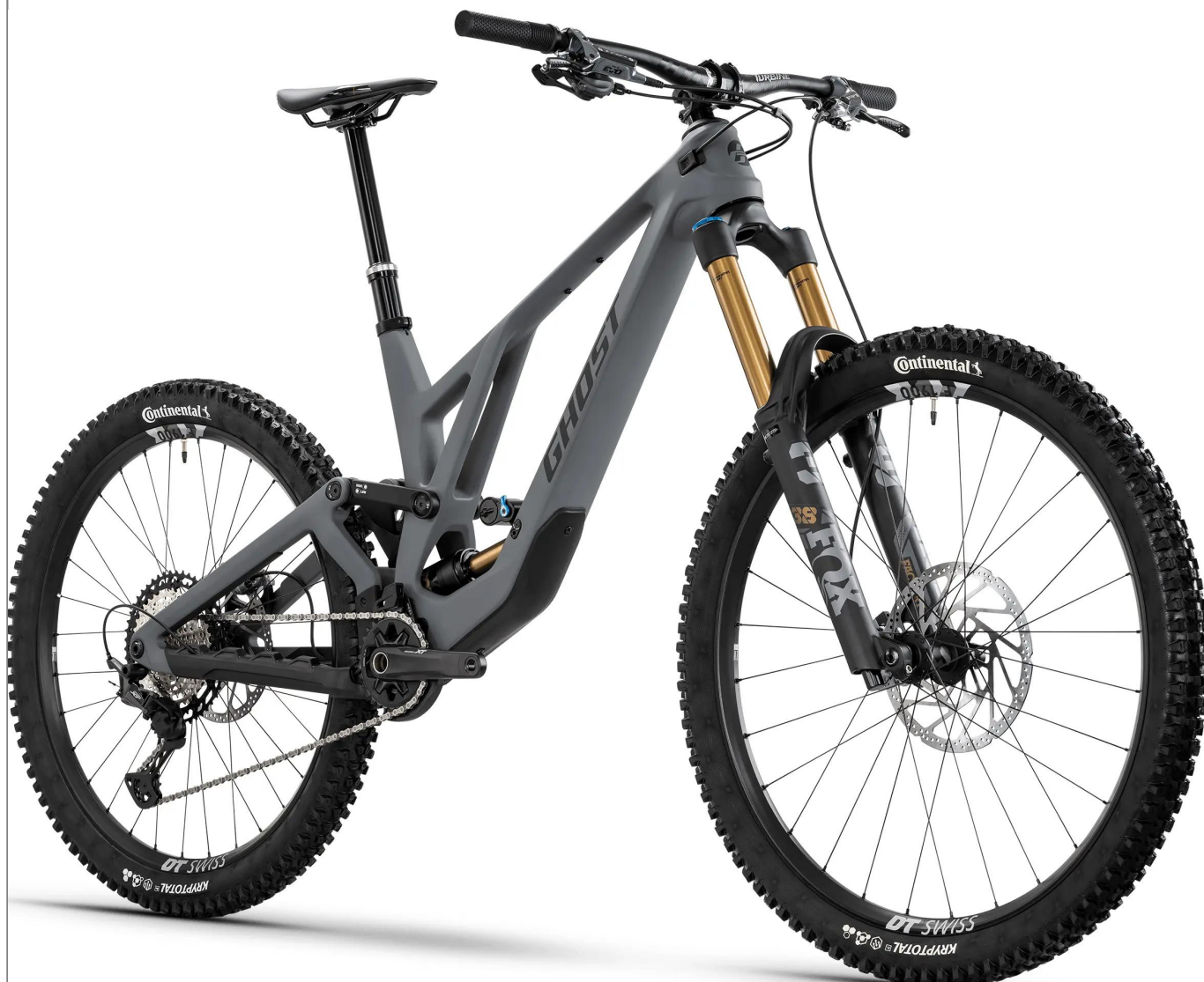
Ghost Poacha Pro – konfiguracja Mullet

konfiguracją Mullet (29"/27.5") oraz ekstremalnie progresywną geometrią, tworząc rower gotowy na najtrudniejsze linie i największe skoki.