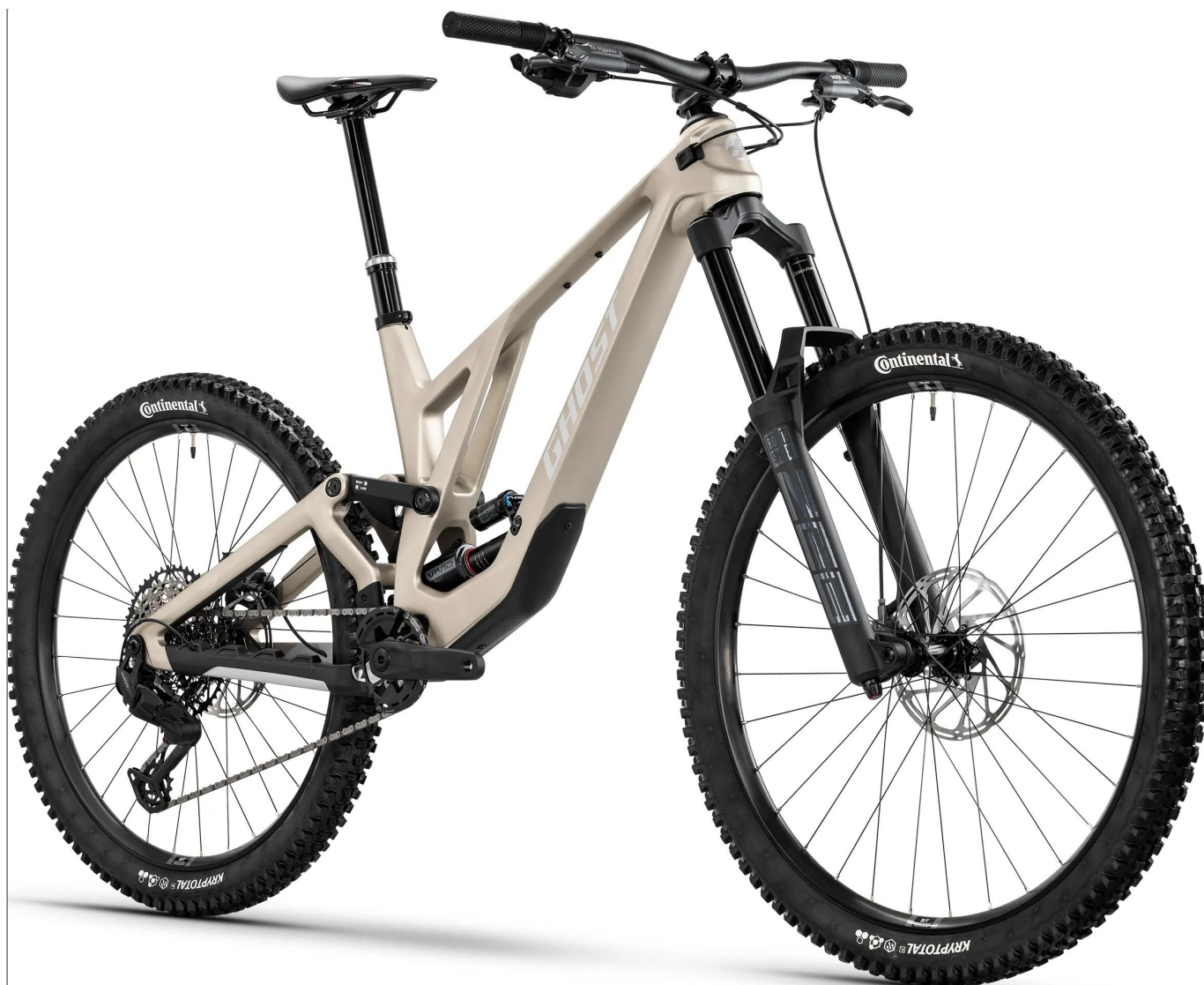
Ghost Poacha - konfiguracja Mullet