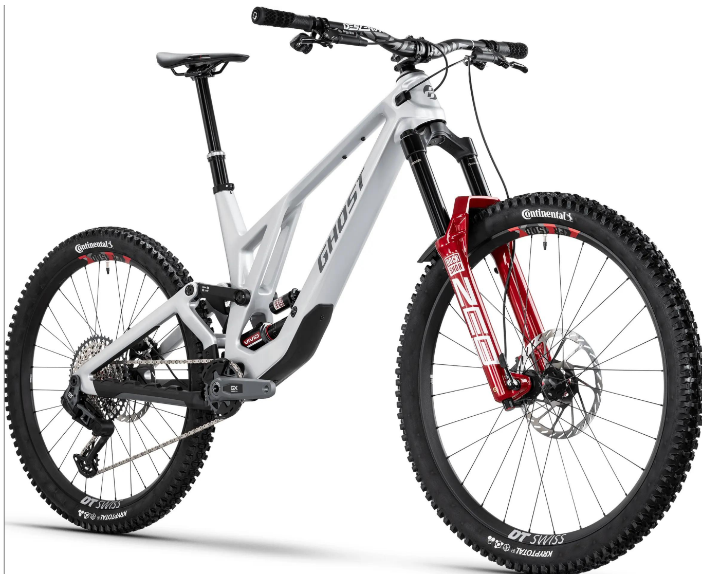
Ghost Poacha Full Party - konfiguracja Mullet