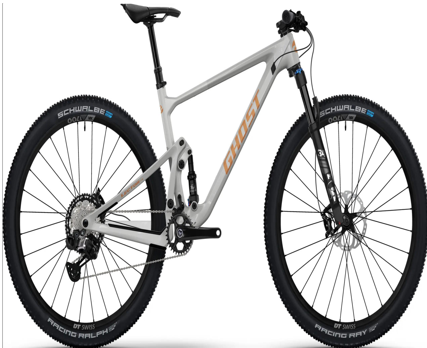
Ghost Lector FS Advanced - kolor szary