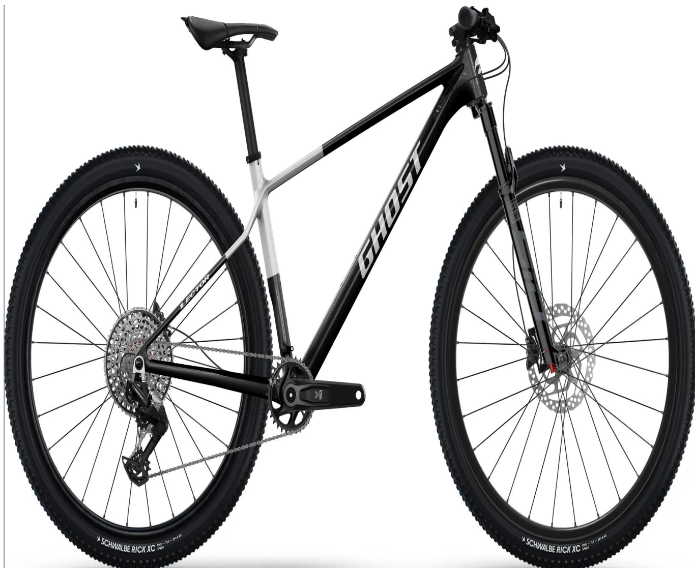
Ghost Lector Advanced - kolor czarny