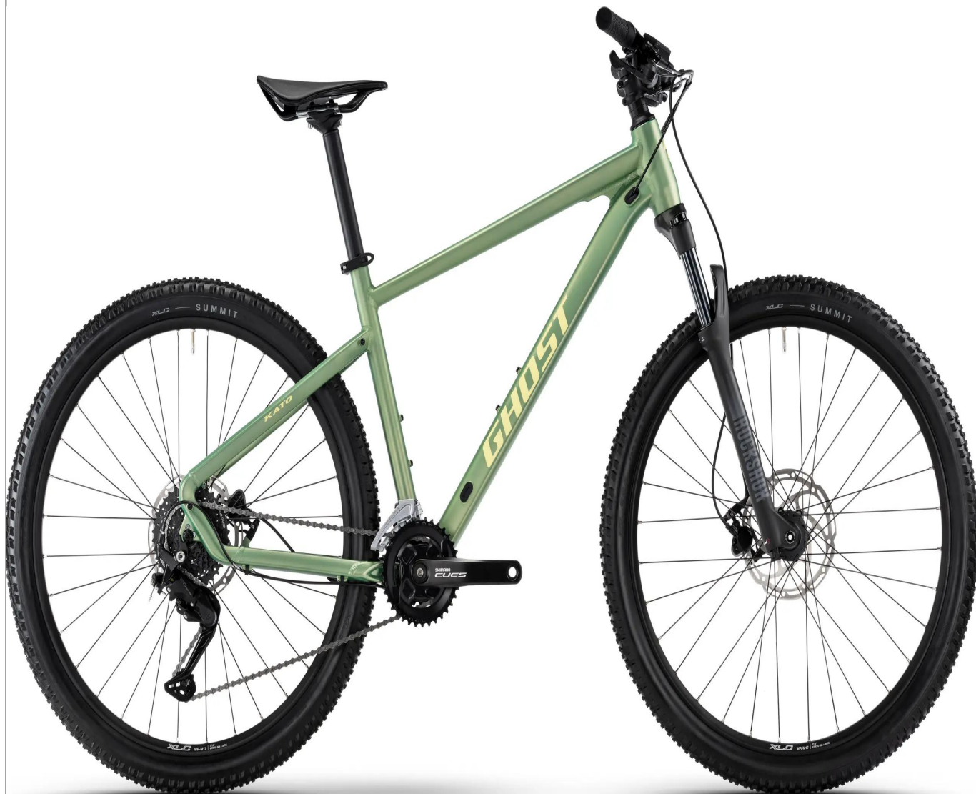
Ghost Kato Universal - kolor zielony

Kompleksowe zestawienie danych dla modelu Ghost Kato Universal. Solidny hardtail wyposażony w amortyzator RockShox, napęd Shimano CUES oraz inteligentny system Size Split dla idealnego dopasowania koła do wzrostu.