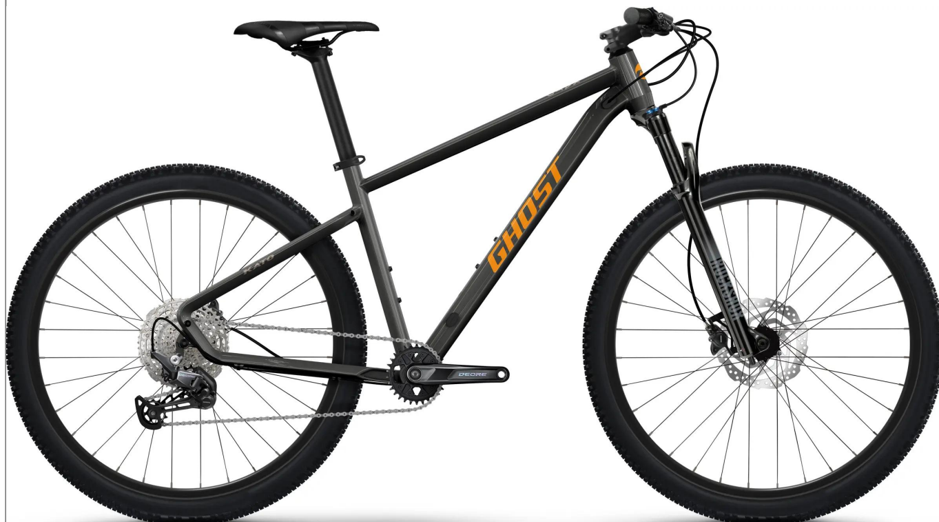
Ghost Kato Pro - kolor czerwony

Najwyższa specyfikacja w legendarnej serii hardtaili Kato. Model Pro wyróżnia się napędem Shimano Deore 1x12, powietrznym amortyzatorem o skoku 100mm oraz inteligentnym systemem Size Split, pozwalającym dobrać rozmiar kół do sylwetki.