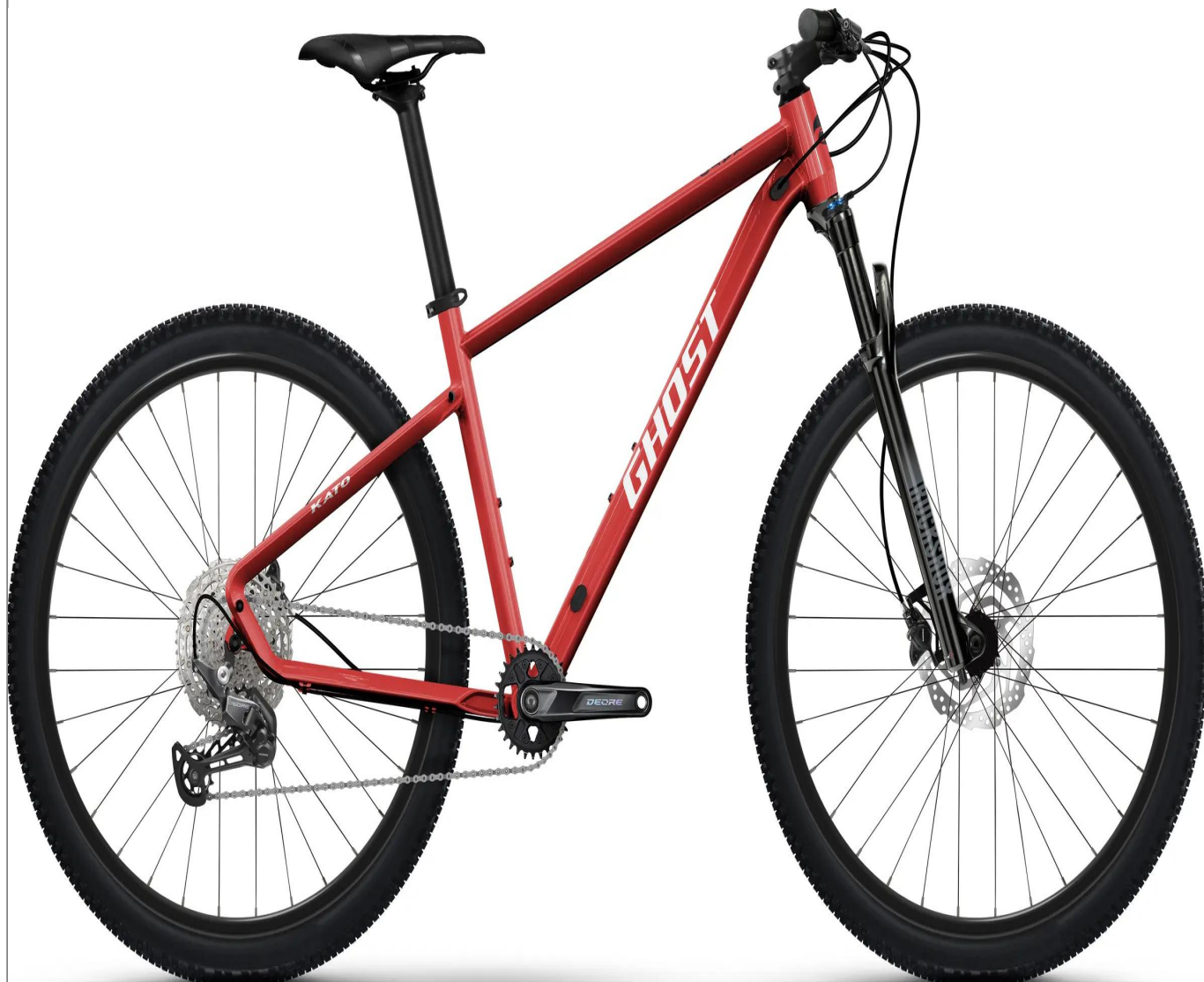
Ghost Kato Pro - kolor czerwony

Najwyższa specyfikacja w legendarnej serii hardtaili Kato. Model Pro wyróżnia się napędem Shimano Deore 1x12, powietrznym amortyzatorem o skoku 100mm oraz inteligentnym systemem Size Split, pozwalającym dobrać rozmiar kół do sylwetki.