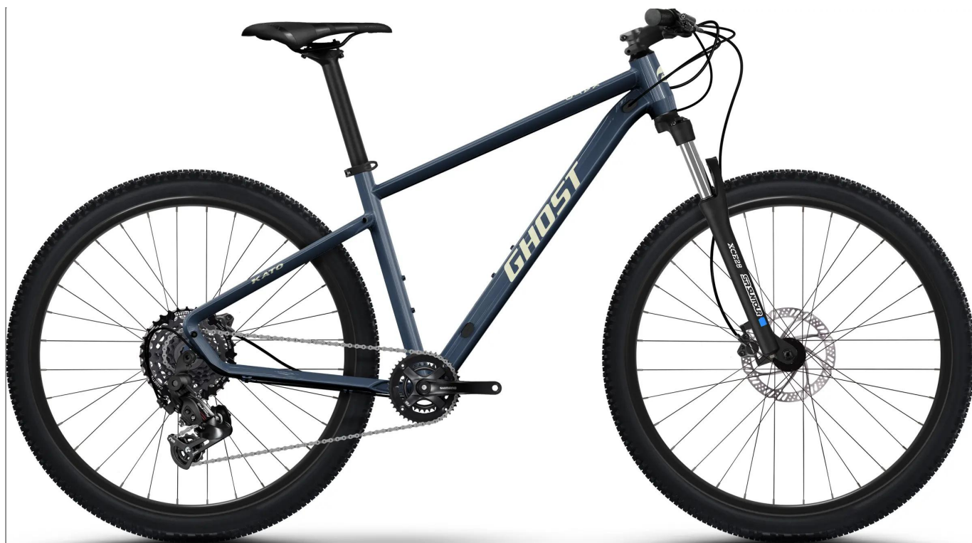
Ghost Kato 2026 - kolor Ice Rose