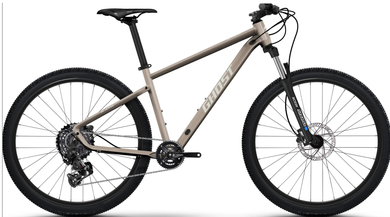
Ghost Kato 2026 - kolor Ice Rose