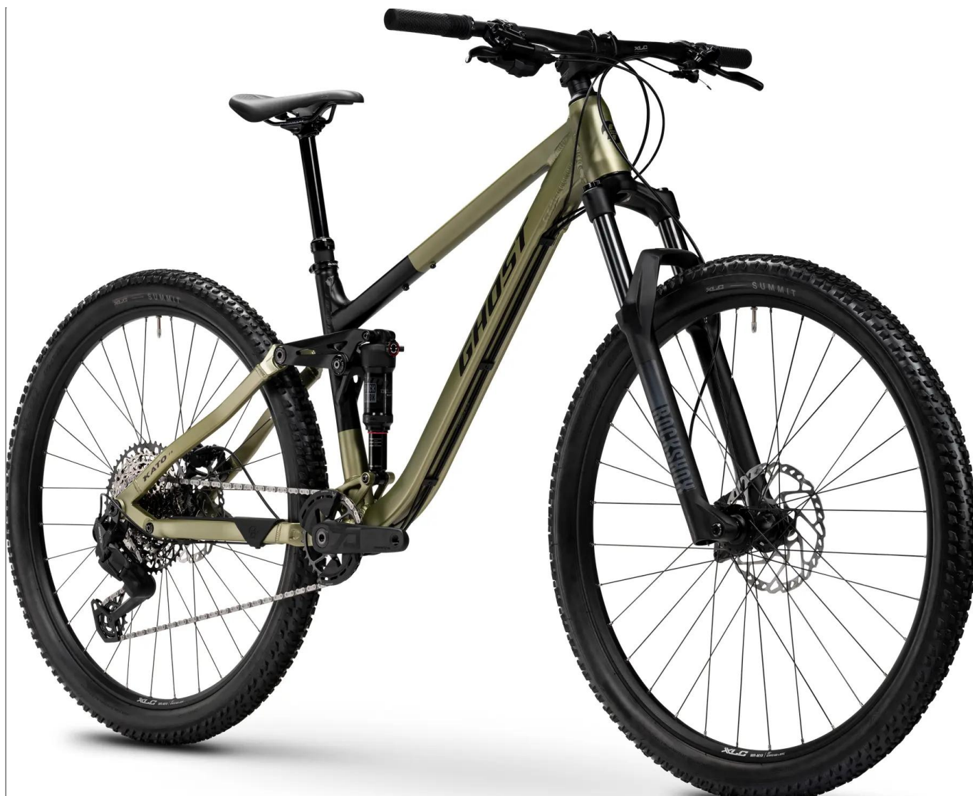
Ghost Kato FS Universal 2026 - kolor Olive