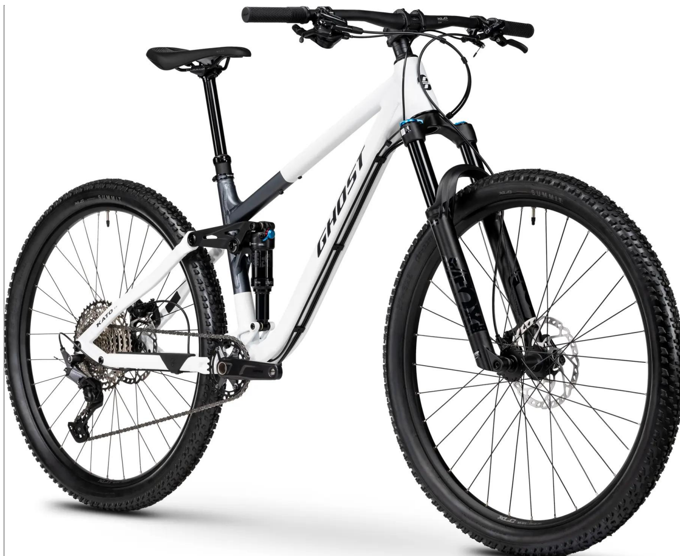
Ghost Kato FS Pro 2026 – kolor biały