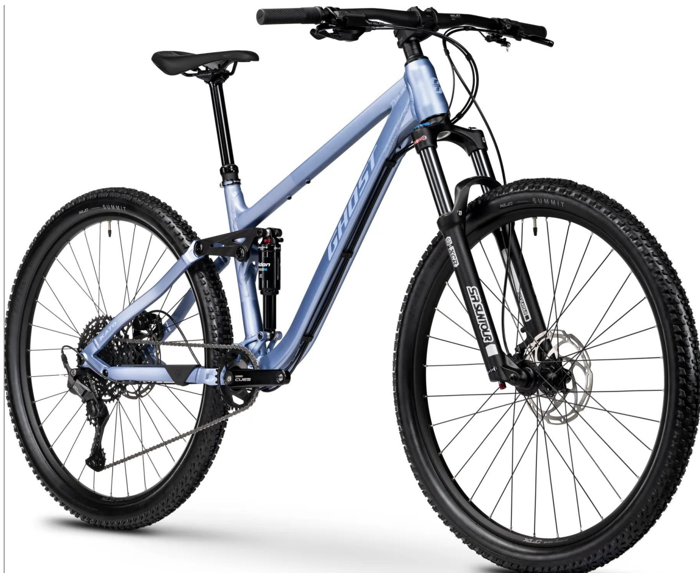
Ghost Kato FS 2026 - kolor niebieski