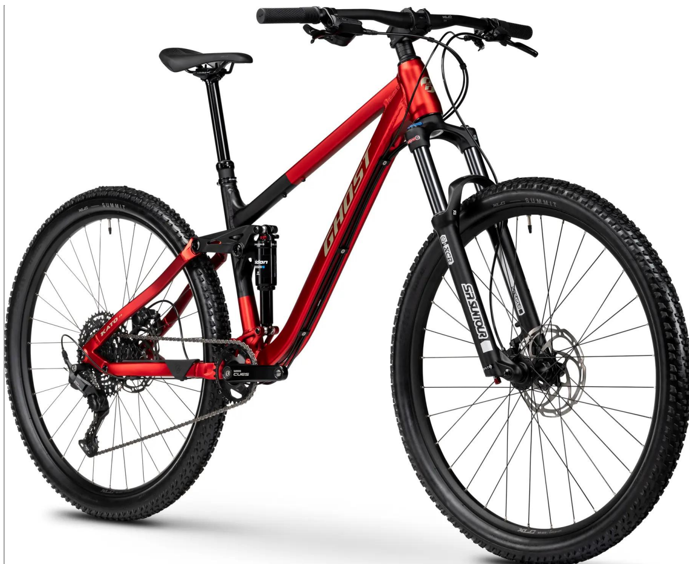
Ghost Kato FS 2026 - trail / full suspension