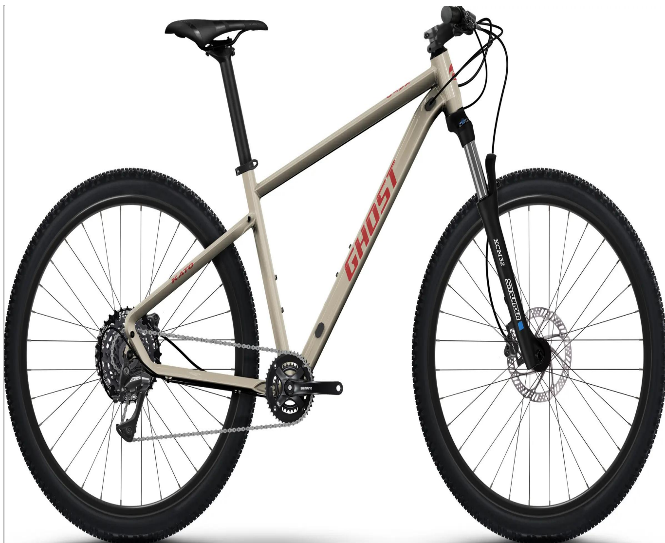
Ghost Kato Essential - kolor szary