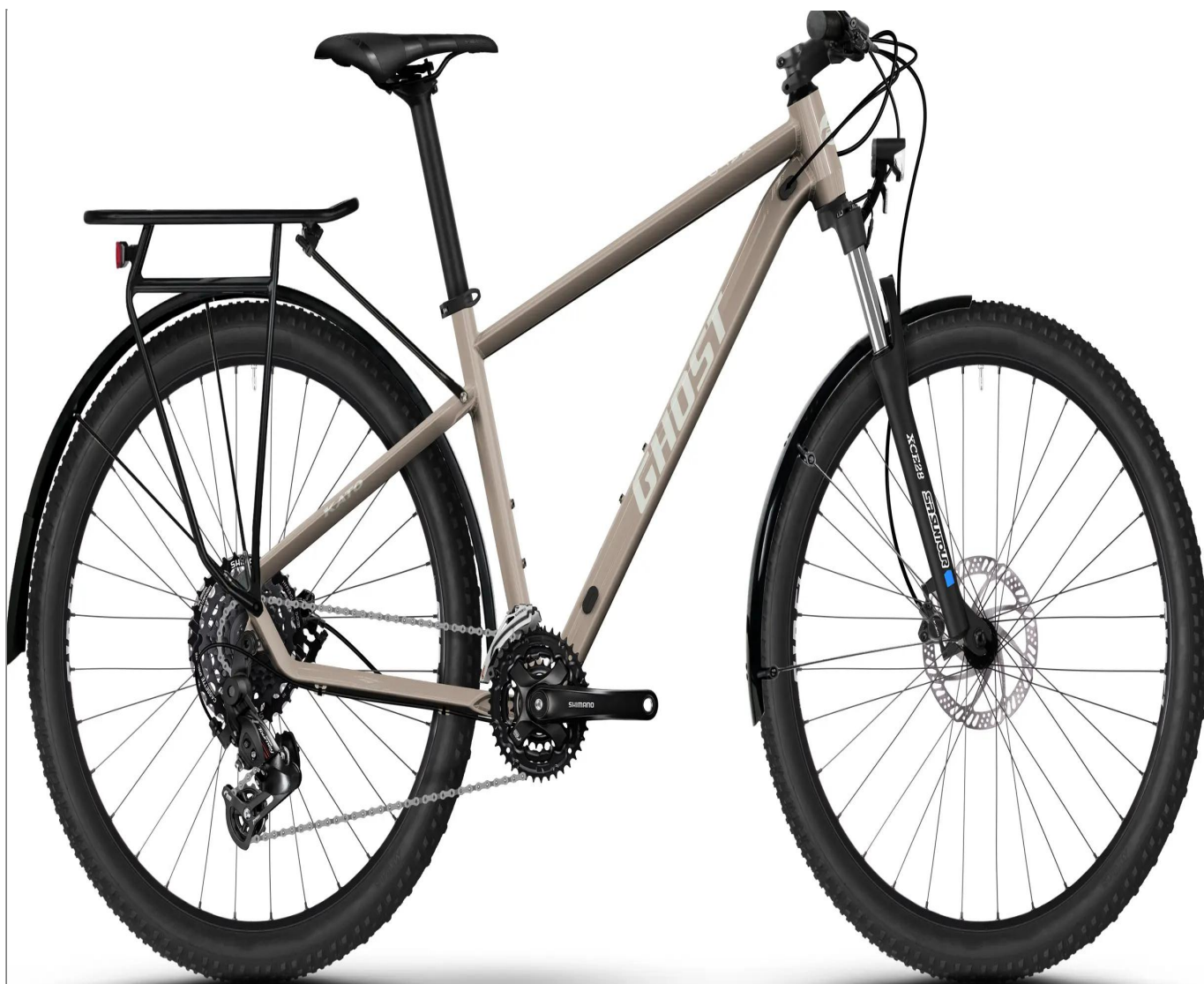
Ghost Kato EQ – kolor Ice Rose