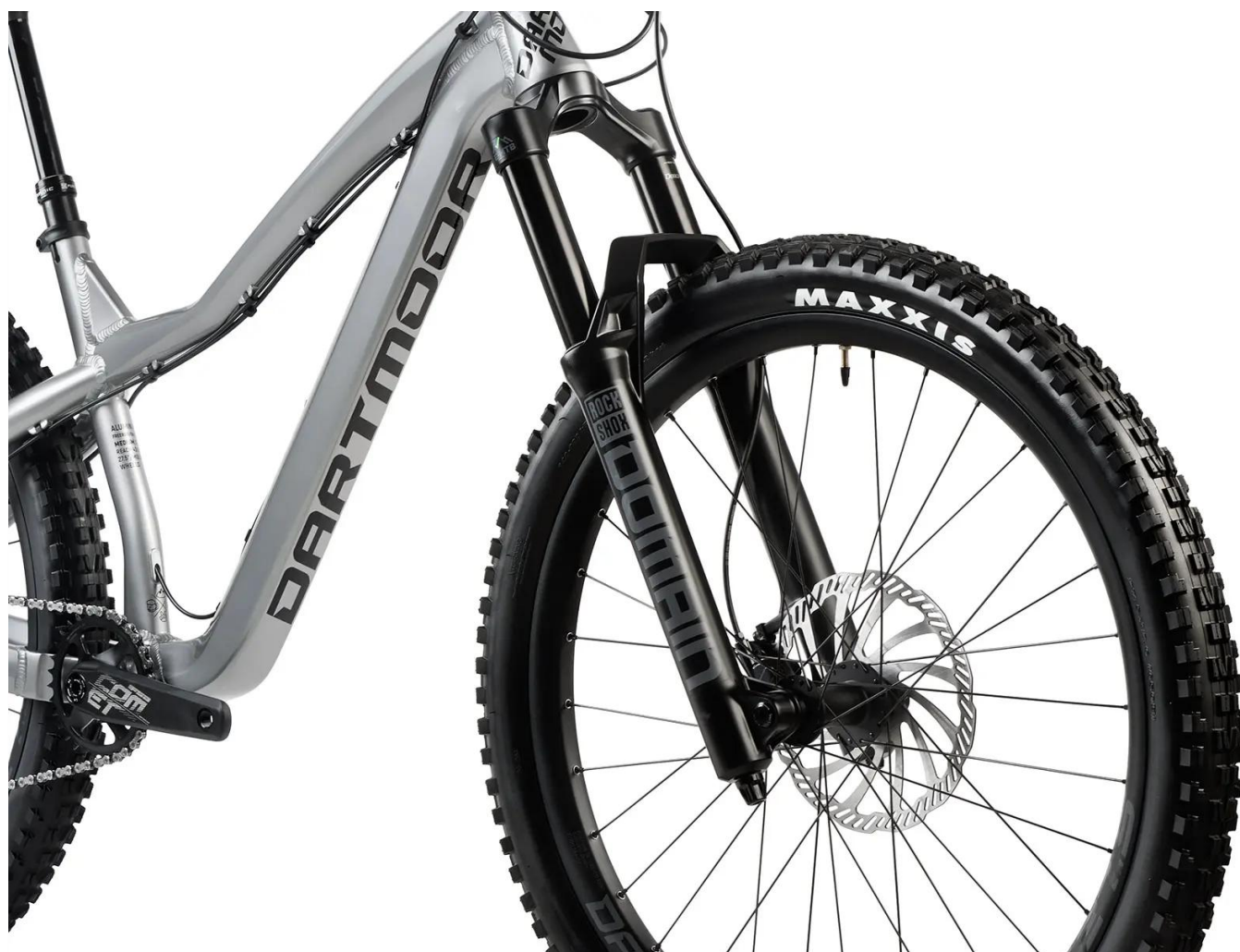
Golenie 38 mm - podwozie z modelu Zeb