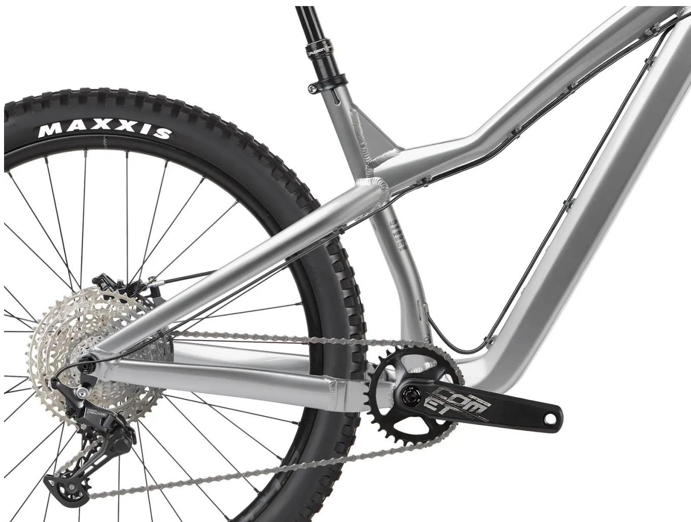
Napęd Shimano Deore M5100 ze sprzęgłem