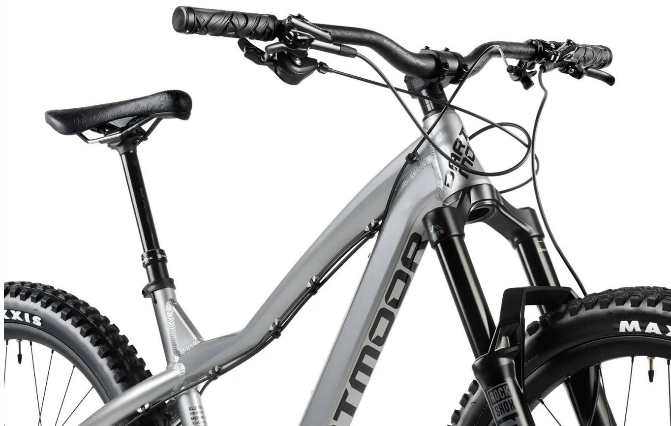
Profesjonalna kierownica Race Face Atlas