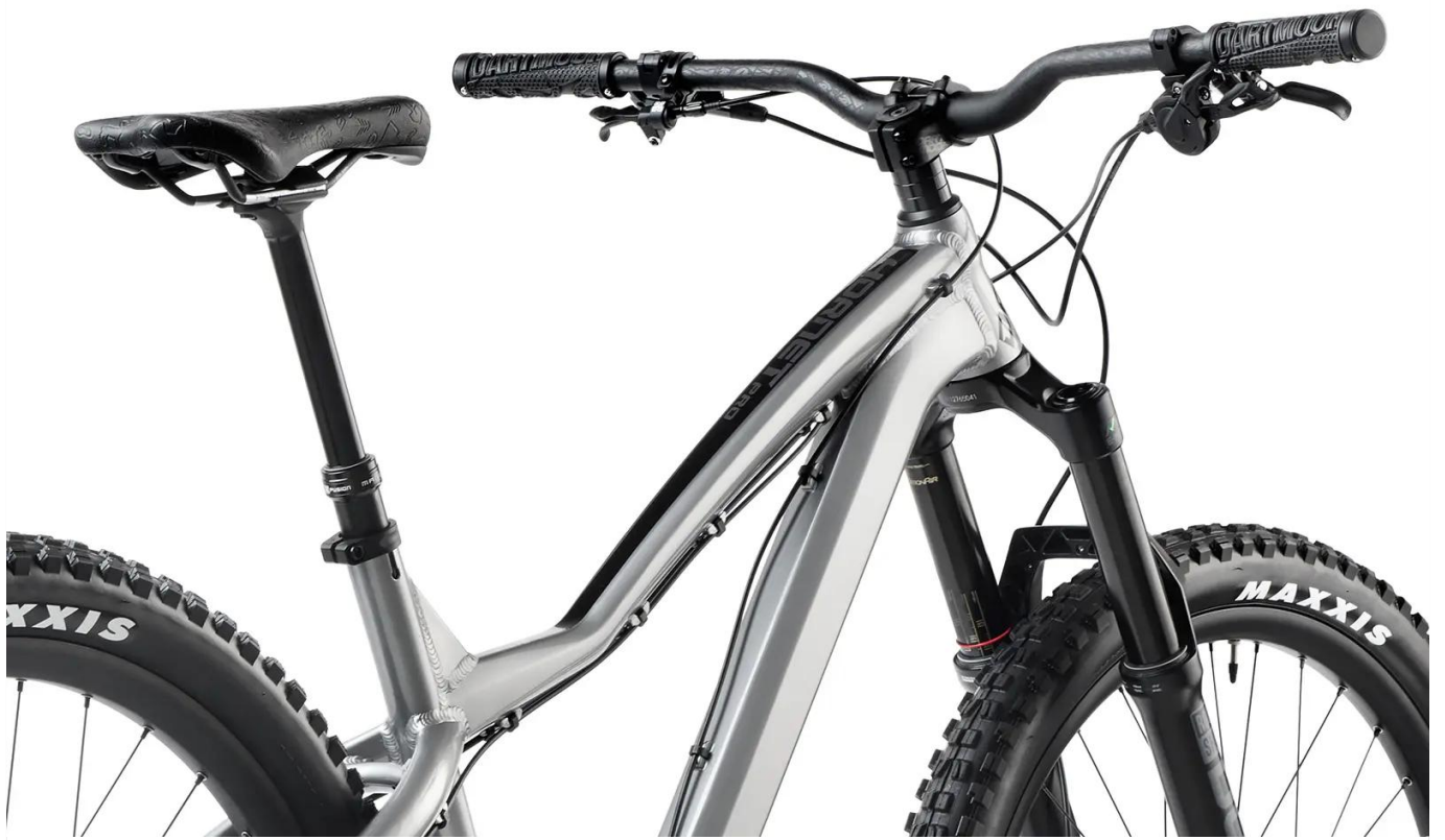
Efektowne wykończenie Dark Chrome