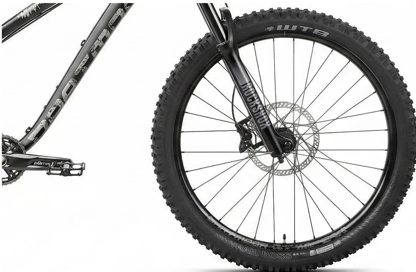
Amortyzator Rock Shox 35 Silver R 150mm