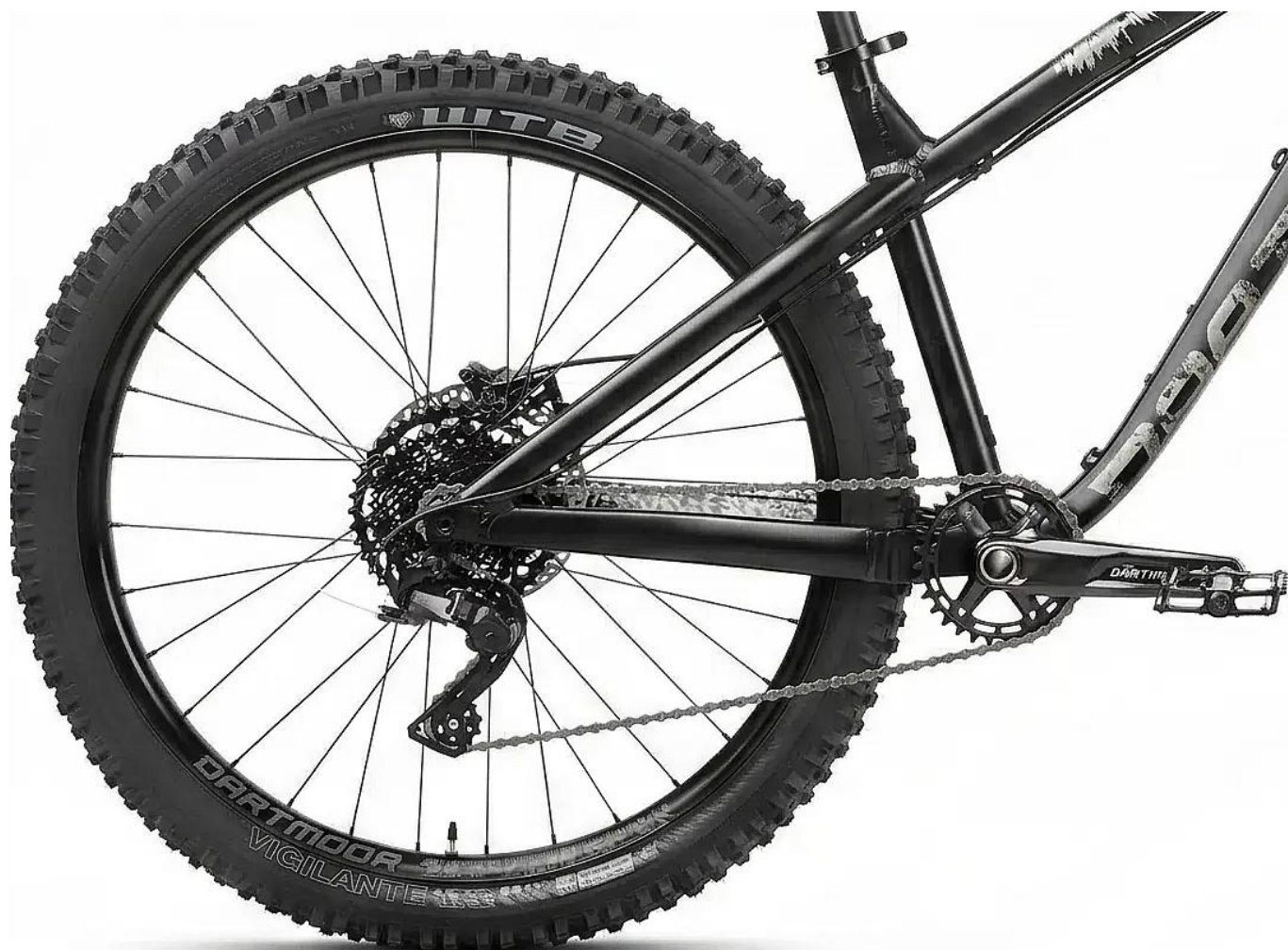
Niezawodny napęd Microshift Advent 1x9