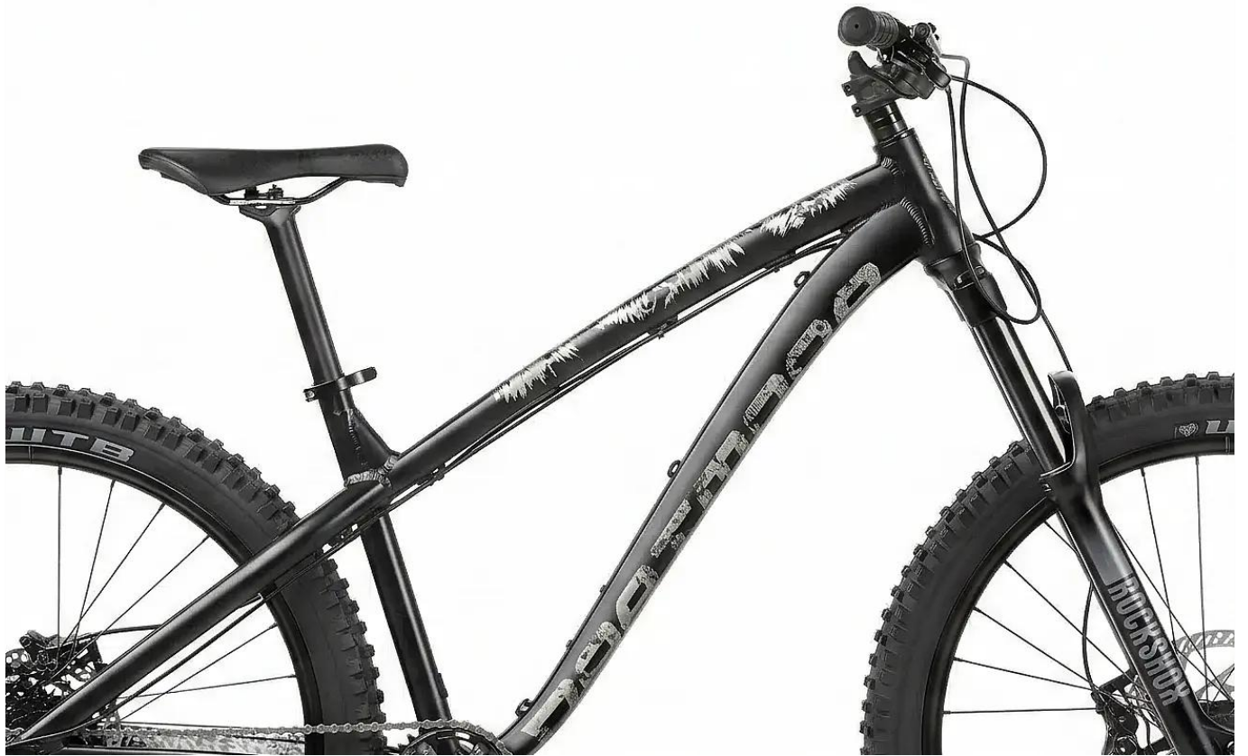
Wytrzymała rama w kolorze czarny/szary mat