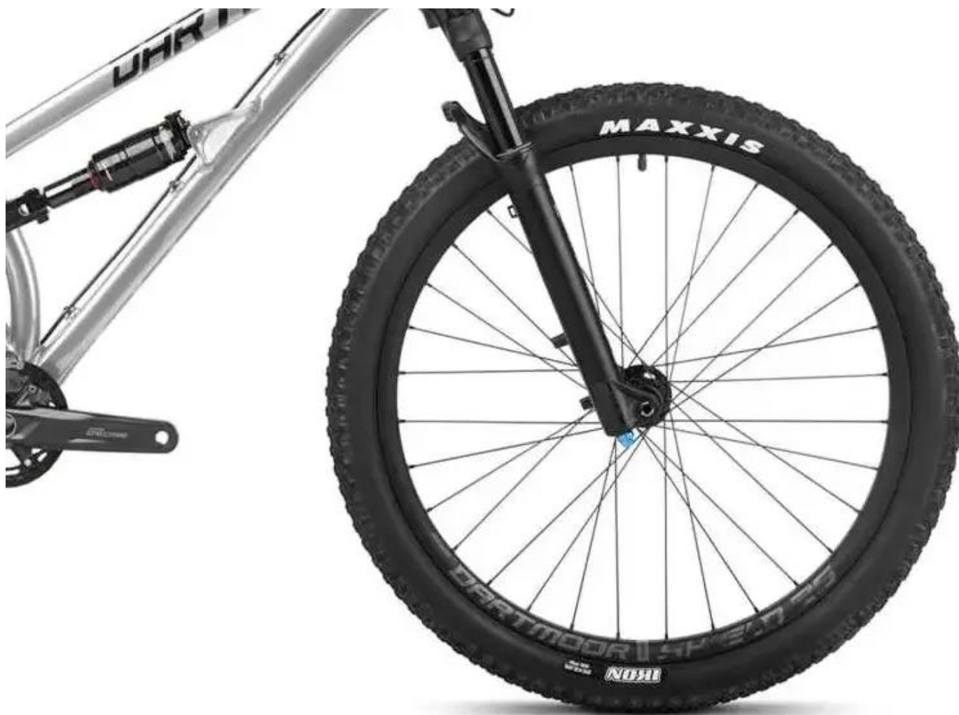
Legendarny widelec Manitou Circus Pro