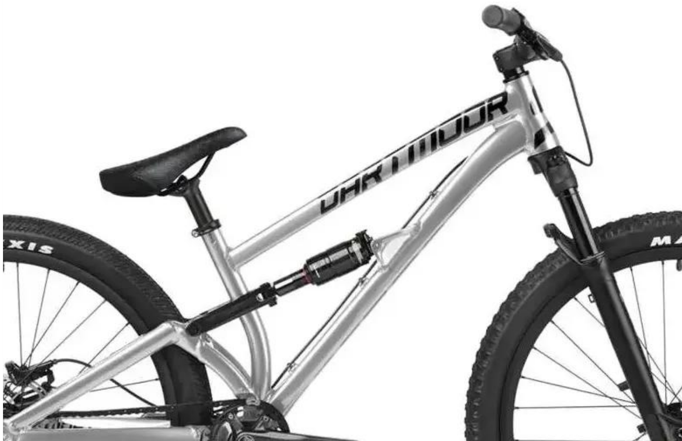
Hydroformowana rama z aluminium 6061-T6