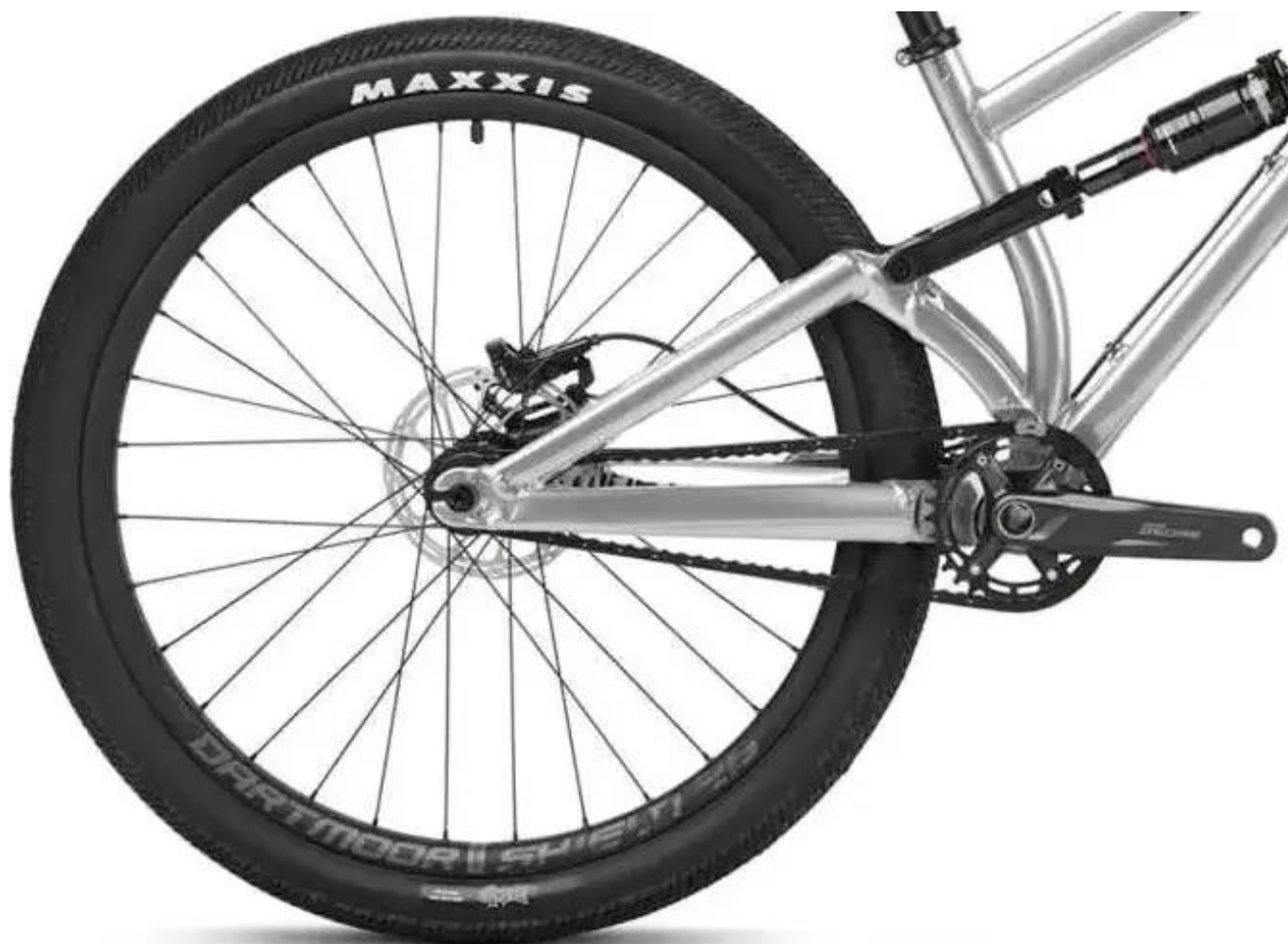
Damper Rock Shox Monarch R i korba Shimano Deore