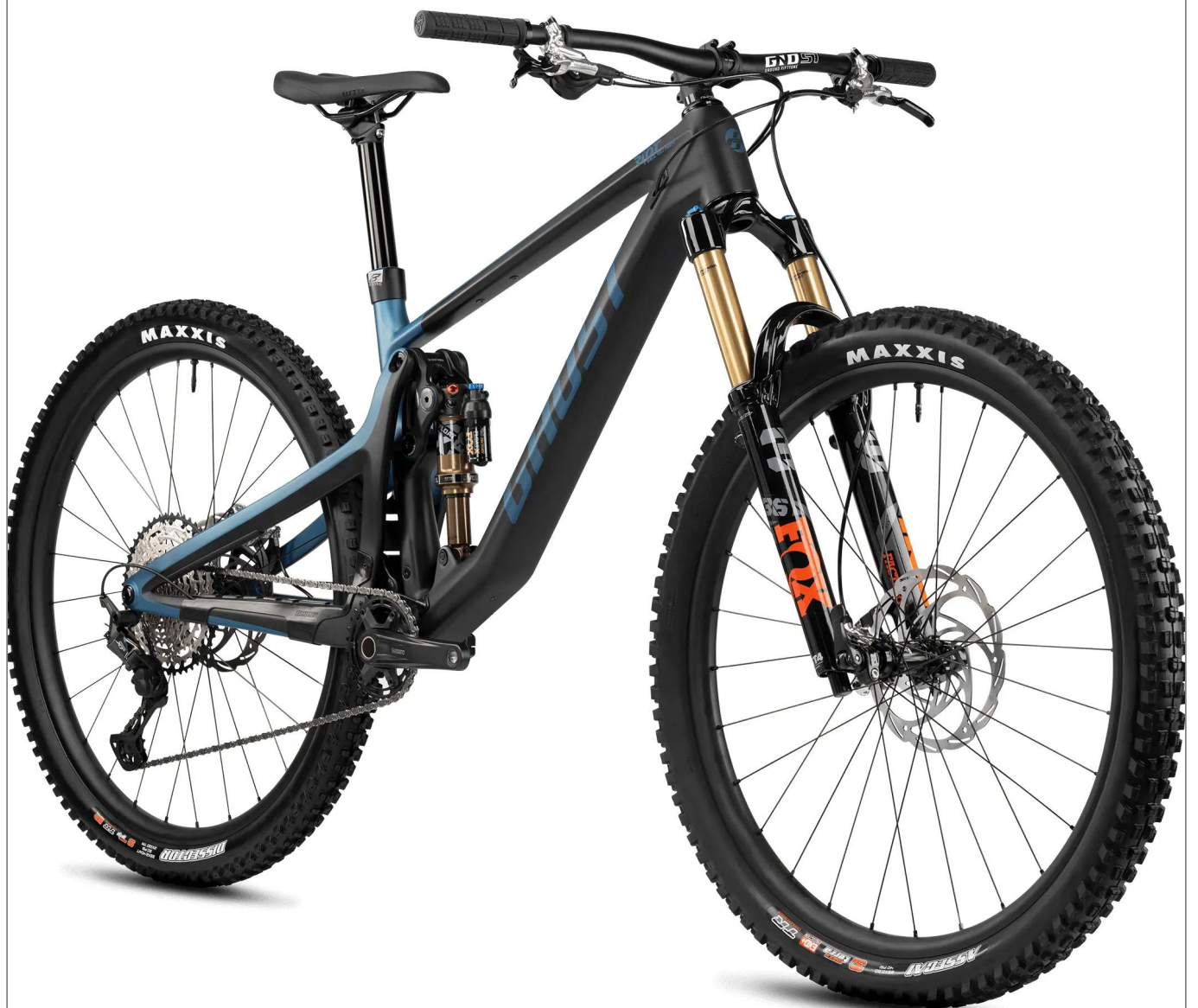
Ghost Riot Trail CF Full Party - kolor srebrny