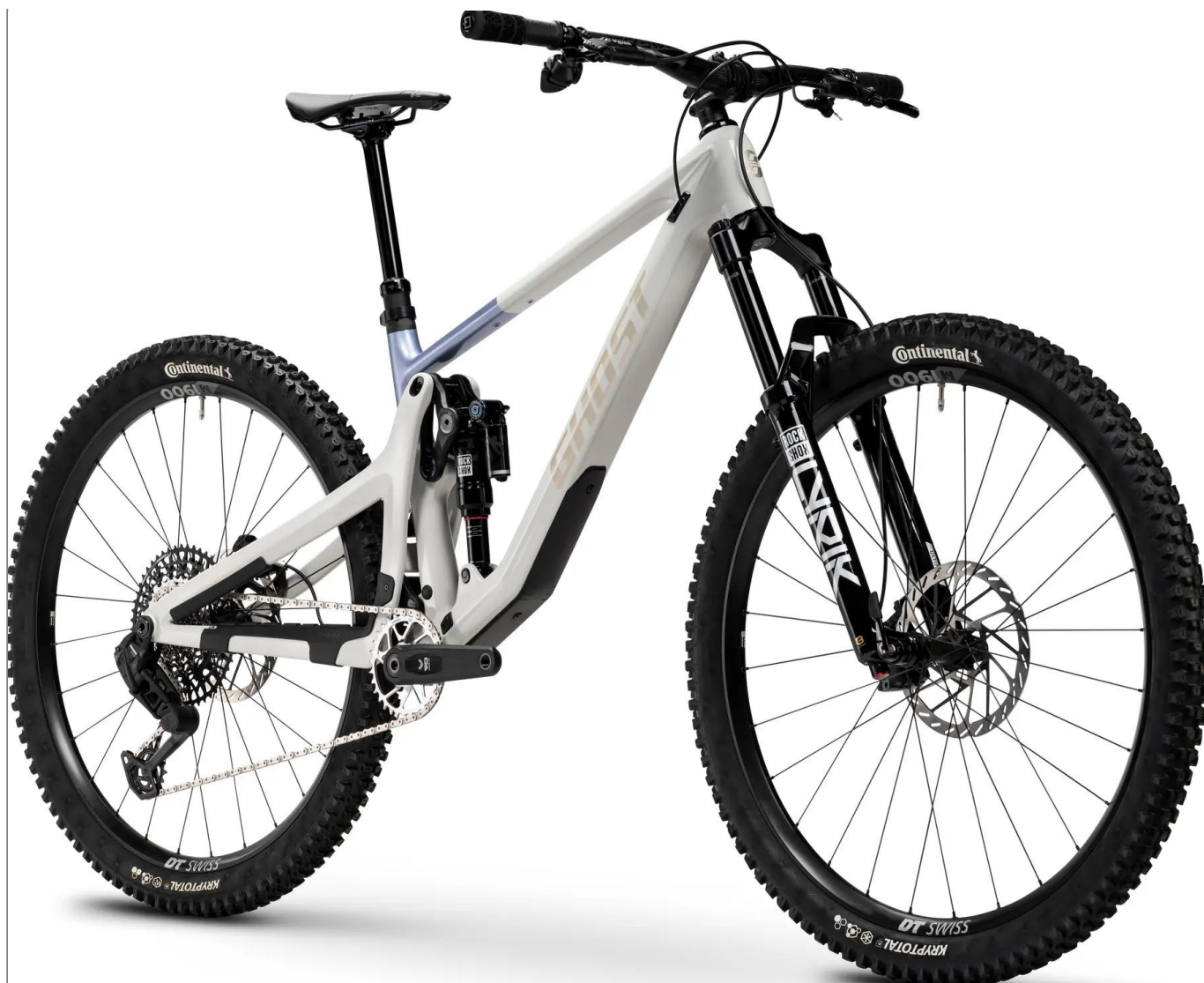
Ghost Riot Trail CF Full Party - kolor srebrny