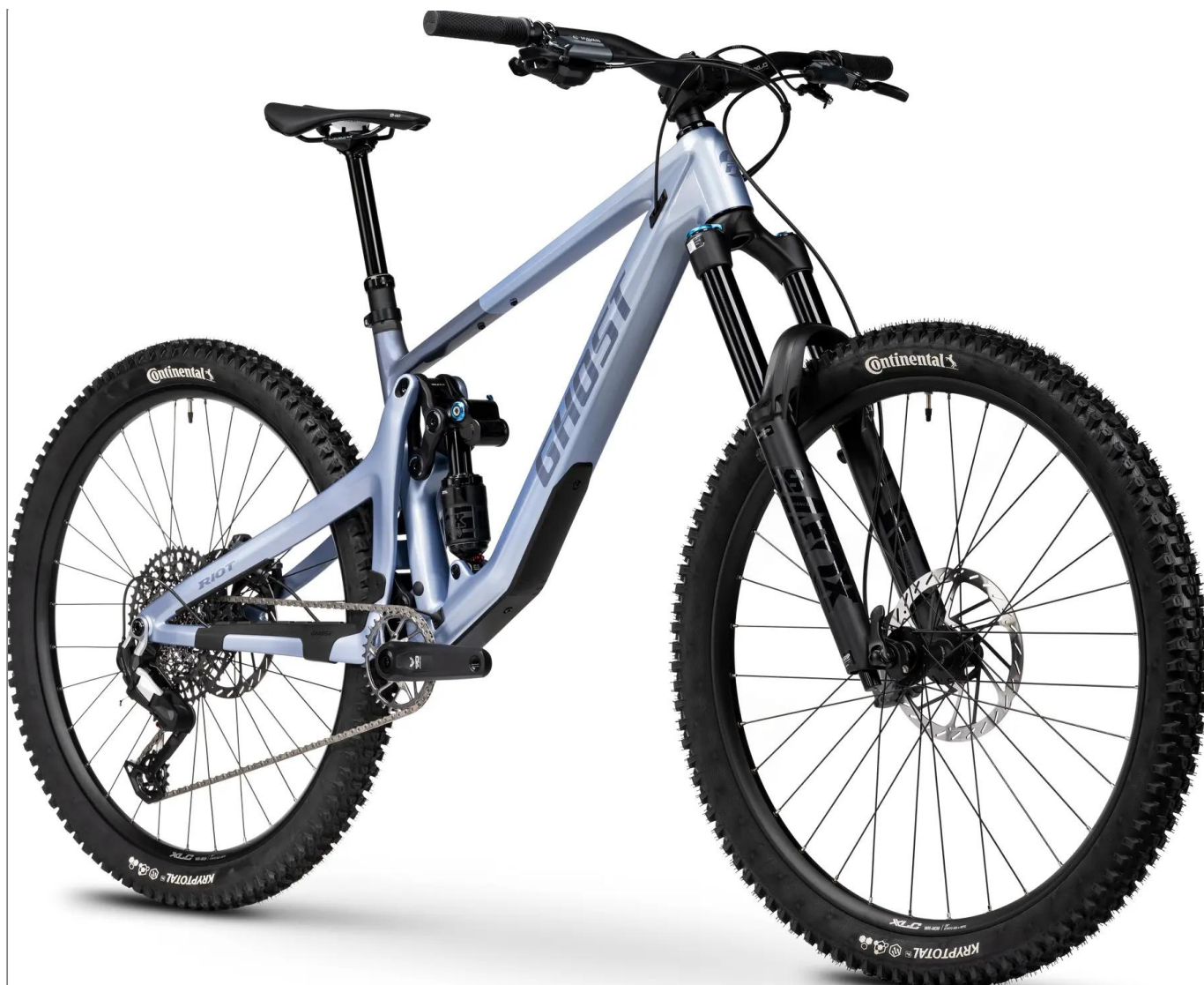
Ghost Riot AM CF Pro 2026 - kolor niebieski