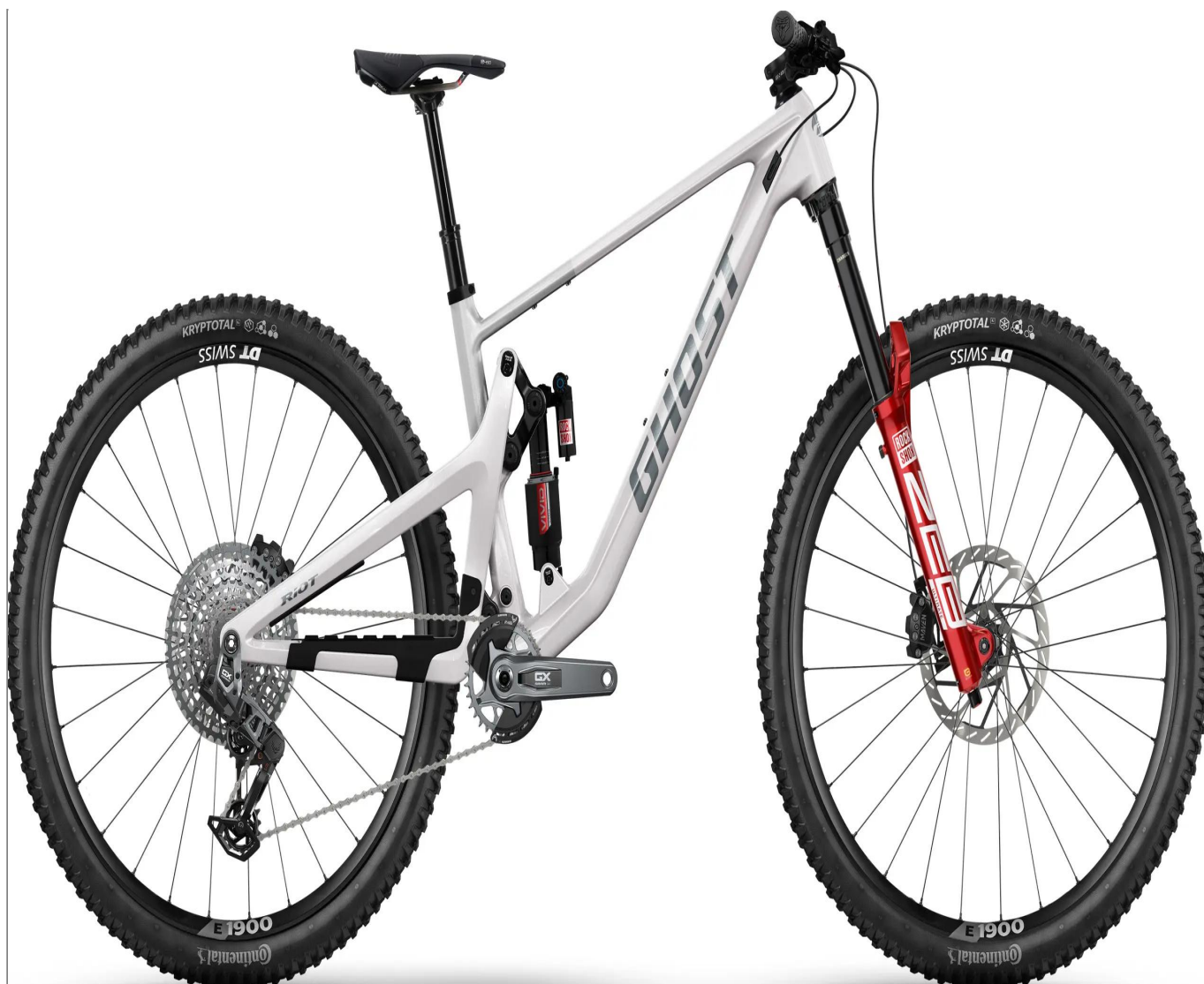
Ghost Riot AM CF Full Party 2026 - kolor srebrny