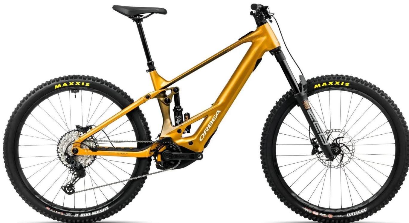
Orbea Wild H20 Mullet - zdjęcie przedstawia konfigurację kół 29"/29"

Lokalizator GPS NotiOne, montaż i konfiguracja - GRATIS