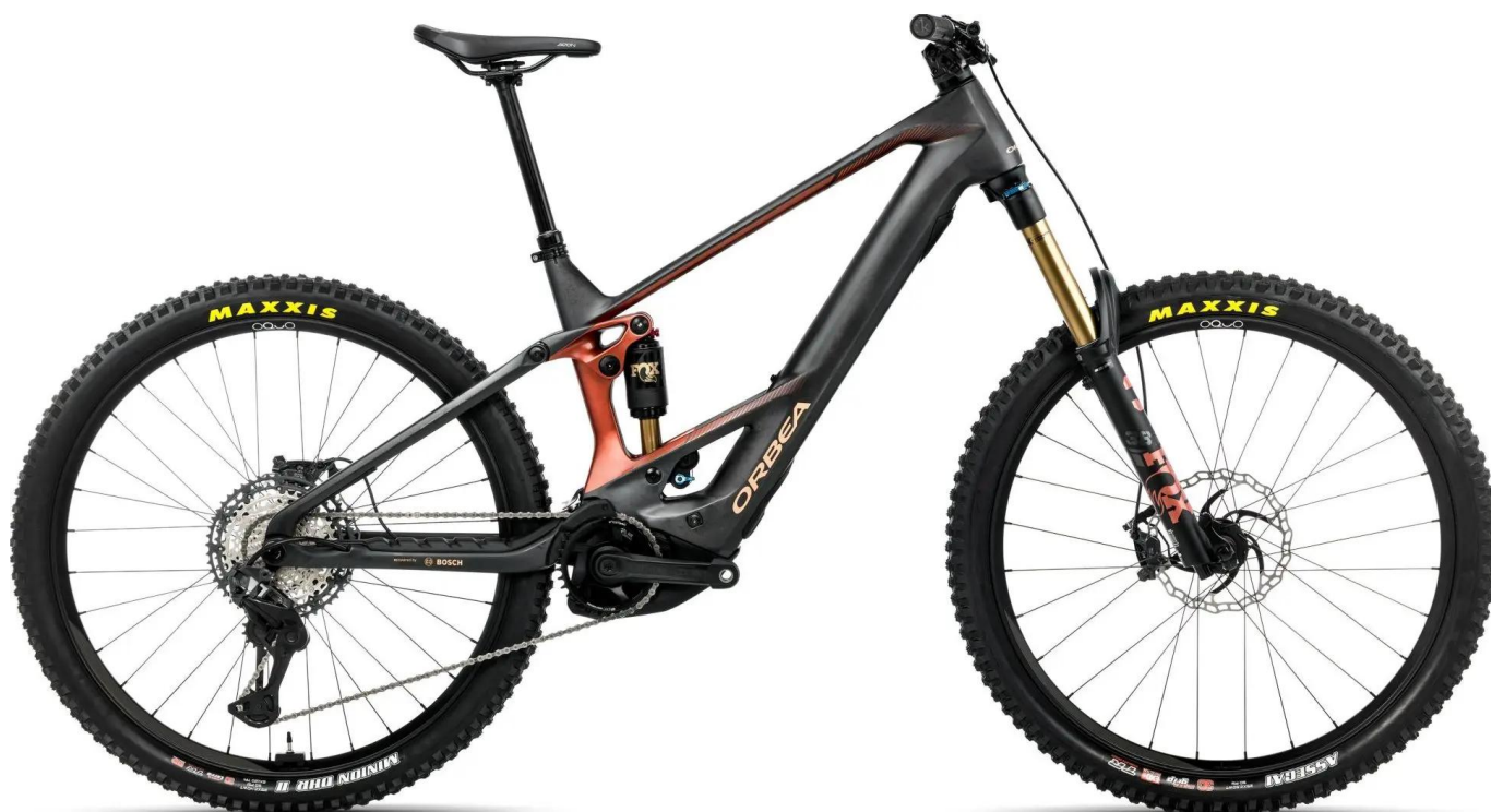
Orbea Wild M-Team 2026 mullet - zdjęcia przedstawiają konfigurację z kołami 29"

rowery "Full Power" mogą tylko pomarzyć.