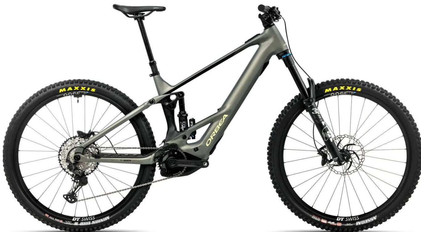
Zdjęcia przedstawiają rower Orbea Wild H10 z kołami 29" , sprawdź konfigurację mullet

Rower wyposażono w pancerne komponenty "heavy-duty": widelec Fox 38 Performance o skoku 170mm oraz niezwykle wytrzymałe koła aluminiowe Oquo Mountain Control MC32TEAM POWER , zaprojektowane specjalnie, by znieść brutalne siły generowane przez e-bike'i w trudnym terenie.