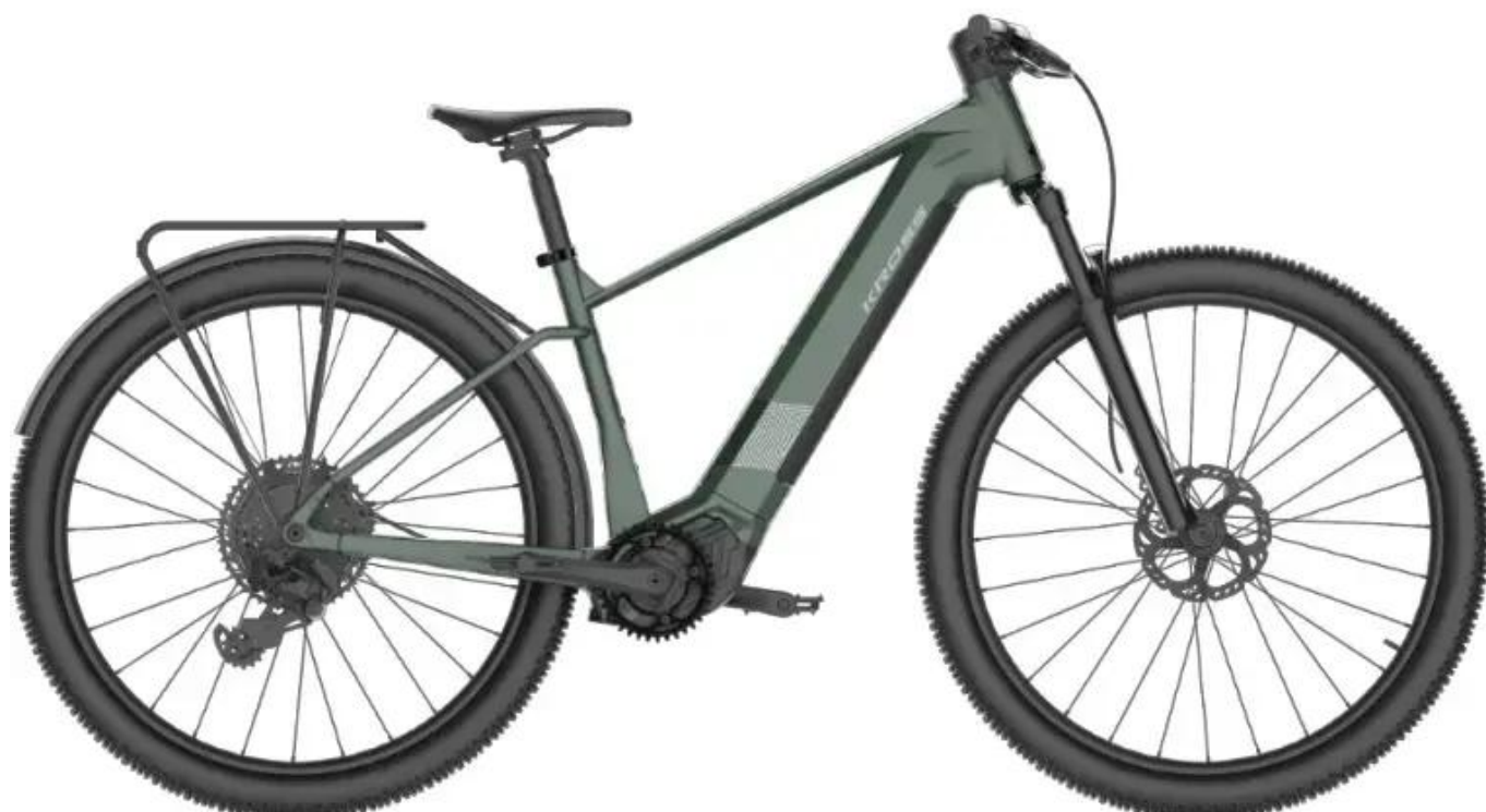
Grafika przedprodukcyjna - niebawem uzupełnimy opis o zdjęcia studyjne