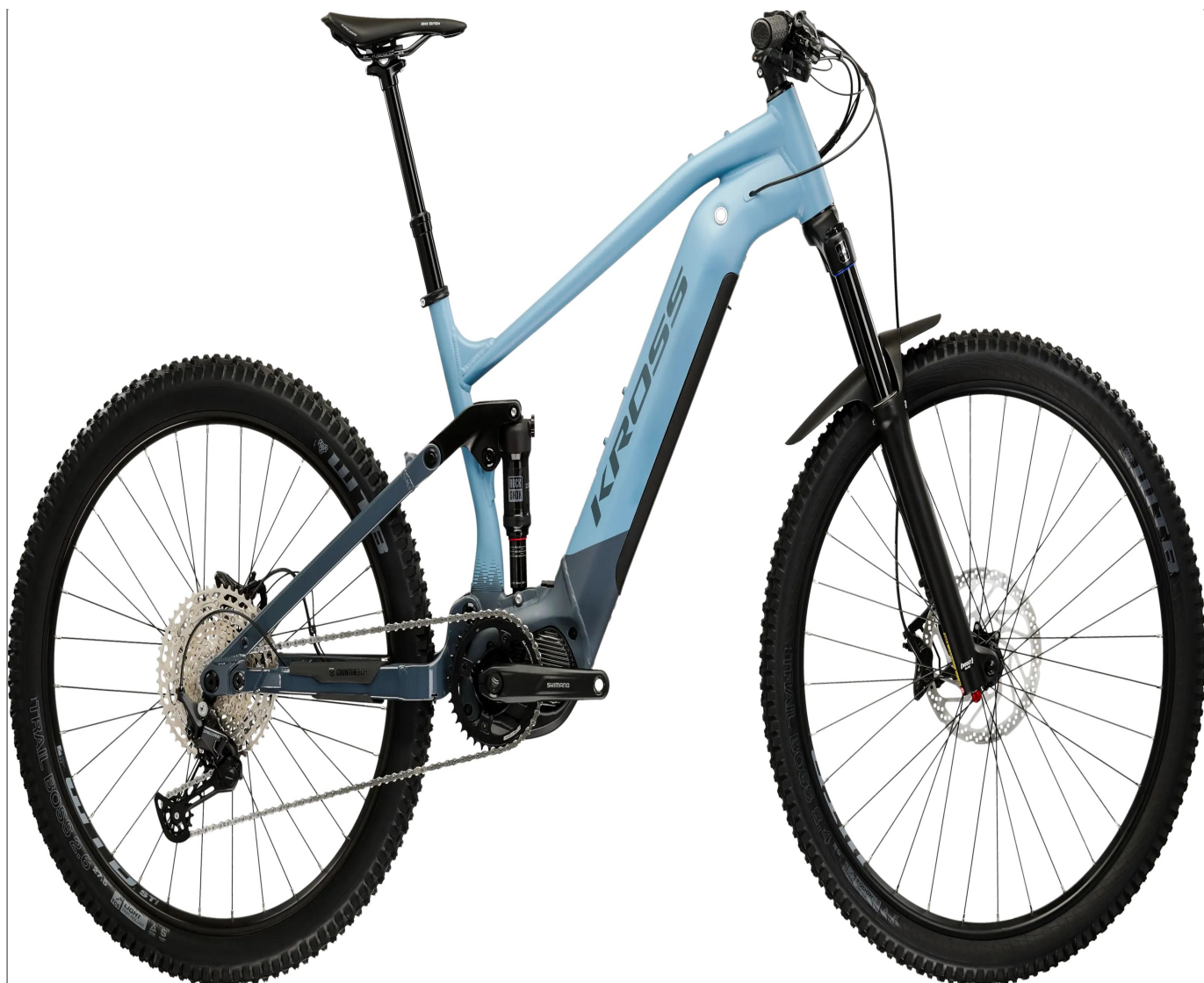
Kross Grist Boost 2.0 - kolor niebieski