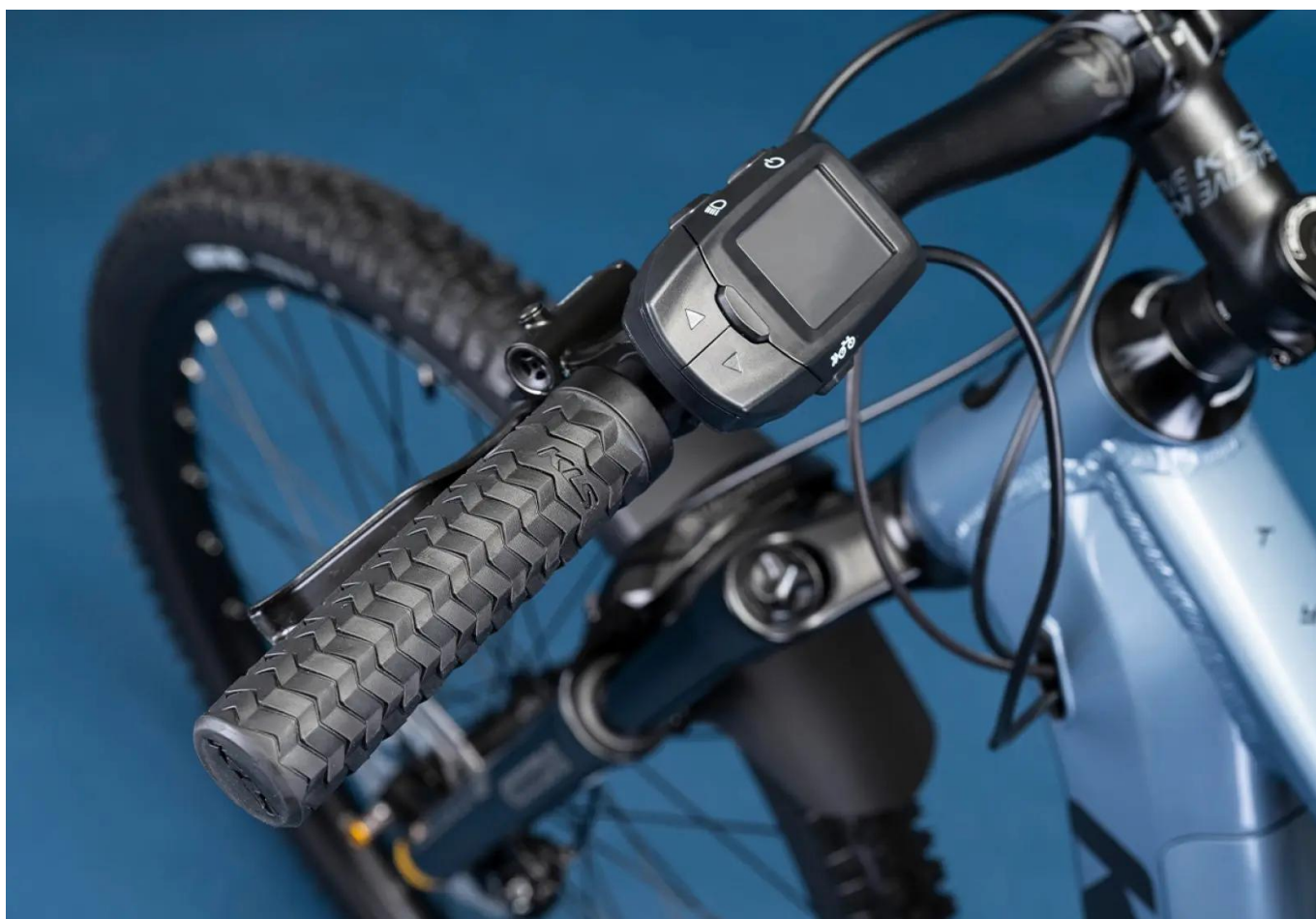
Galeria detali Kellys Tygon R50 P: