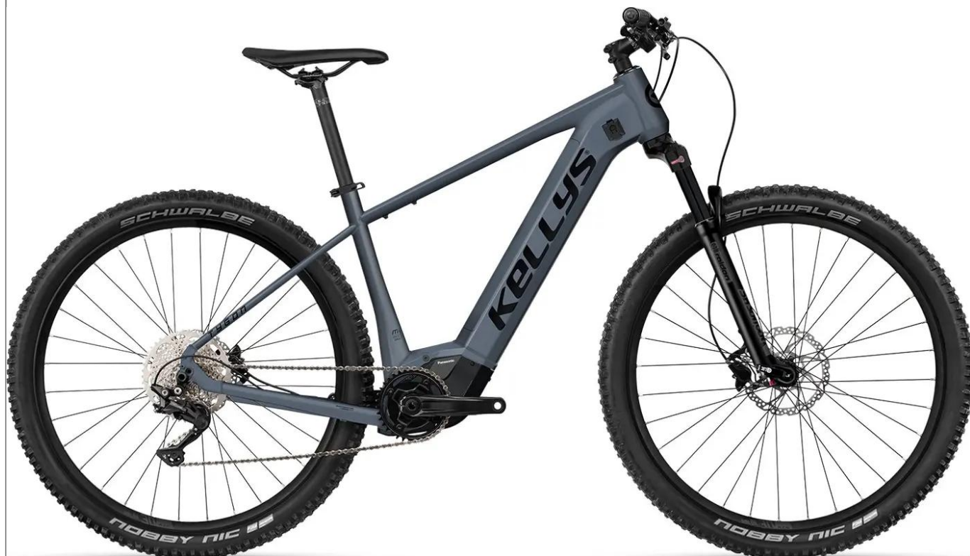
Kellys Tygon R50 P - wyczynowy charakter e-MTB

Zaawansowany męski hardtail e-MTB, który łączy agresywną geometrię XC z potężnym wsparciem elektrycznym. Zaprojektowany do pokonywania trudnych podjazdów i technicznych zjazdów przy zachowaniu maksymalnej kontroli i stabilności kół 29 cali.