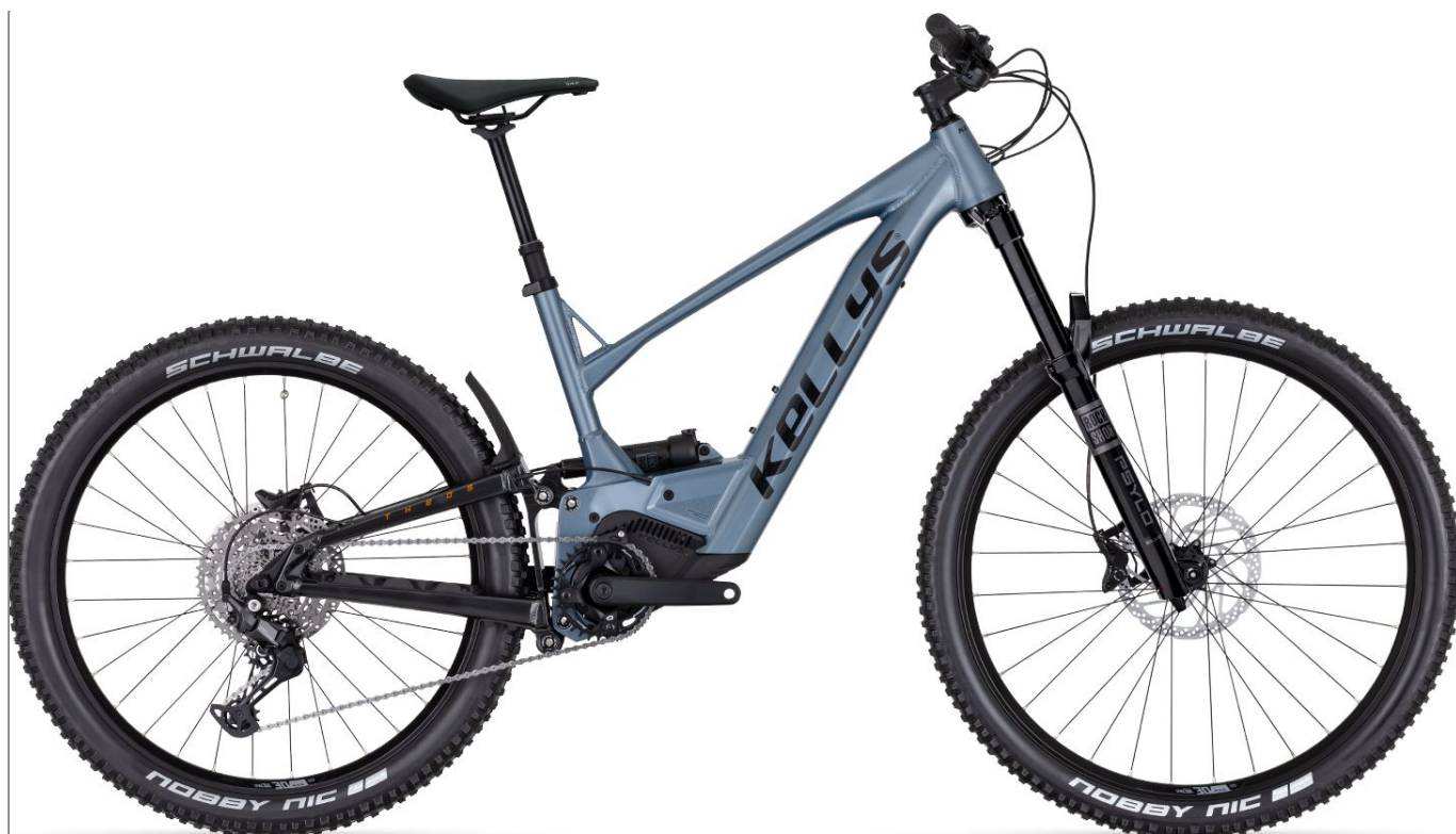
Kellys Theos R30 P Steelblue